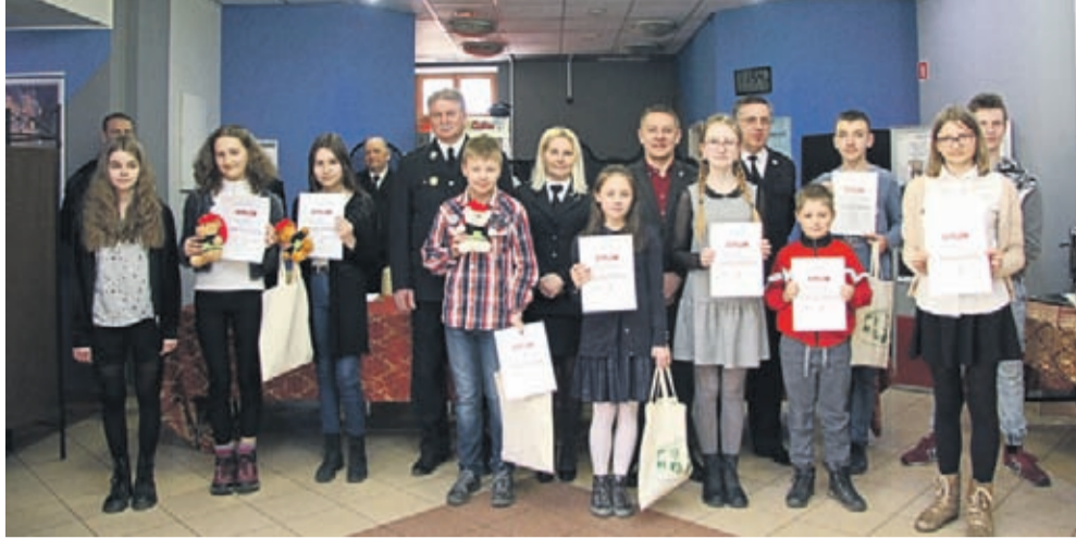
Laureaci i organizatorzy gminnego etapu Turnieju

Jak co roku, w Turnieju wystartowali uczniowie ze szkół podstawowych i klas gimnazjalnych z terenu Gminy Środa Śląska. Musieli oni najpierw przejść eliminacje szkolne, a następnie 13 marca br. stanęli w szranki do etapu gminnego. Zwycięzcy to: