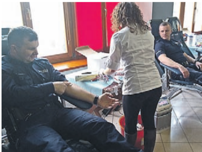
Krwiodawstwa i Krwiolęcznictwa we Wrocławiu.

Obsługę medyczną zapewnił personel Regionalnego Centrum