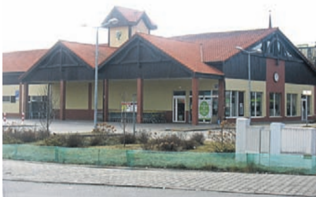
Niedziela pod sklepami była spokojna.

Też udaliśmy się na rekonesans. Około dwudziestu minut