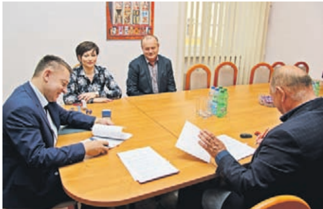
Podpisanie umowy na przebudowę ul. Górnej w Rakoszycach.

Przewidziano między innymi wyłanie nawierzchni asfaltowej, wykonanie miejsc postojowych oraz budowę chodnika, a za-