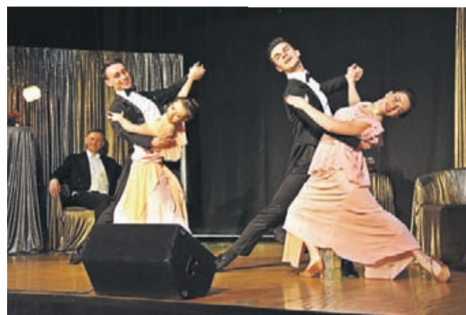
Artyści Wieczoru Operetkowego „Zemsta Nietoperza” w średzkim Domu Kultury.

rać najlepsze spośród 16 gminnych wydarzeń kulturalnych. Była też możliwość zaproponowania wydarzenia spoza listy. Pierwszą trójkę stanowią: