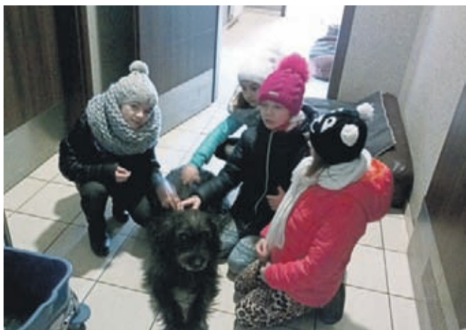
Dziewczyny przekazały na rzecz podopiecznych schroniska karmę