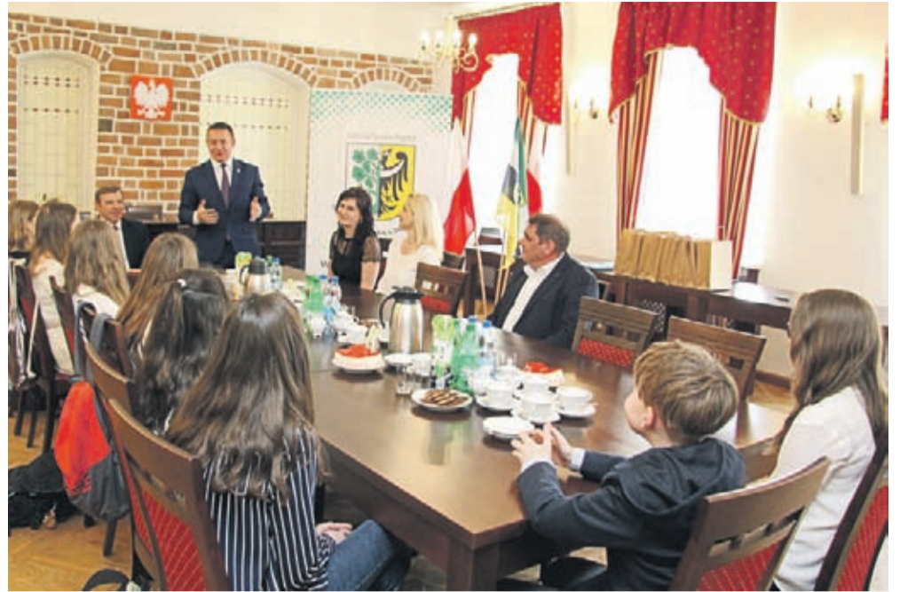
Burmistrz zaprosił laureatów do sali obrad UM

Podczas uroczystości wszyscy laureaci otrzymali indywidualne nagrody, wśród nich m.in. gry Memory nt. osobliwości gminy i miasta Środa Śląska, okolicznościowe albumy na 100 lecie Niepodległości Polski poświęcone regionowi jakim jest Dolny Śląsk, wakacyjne bilety Średzkiej Komunikacji Publicznej oraz