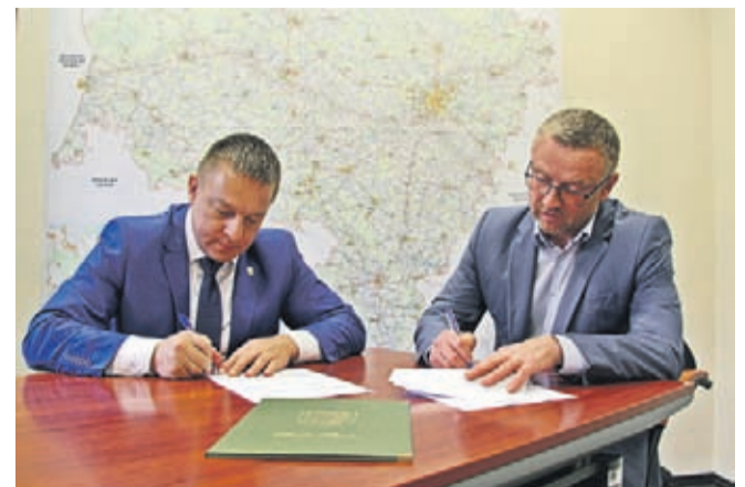
Zawarcie porozumienia z GDDKiA 17 kwietnia.

Porozumienie z GDDKiA dotyczy współpracy przy realizacji dokumentacji projektowej dla inwestycji pn. Budowa sygnalizacji świetlnej wraz ze zmianą geometrii skrzyżo-