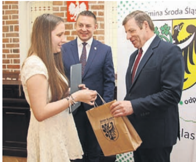
Laureaci dostali nagrody oraz dyplomy

wspólną niespodzianką dla całej grupy pisarskiej – tematyką wycieczkę do Muzeum Pana Tadeusza we Wrocławiu lub Muzeum Papiernictwa w Dusznikach Zdroju (do wyboru przez grupę).