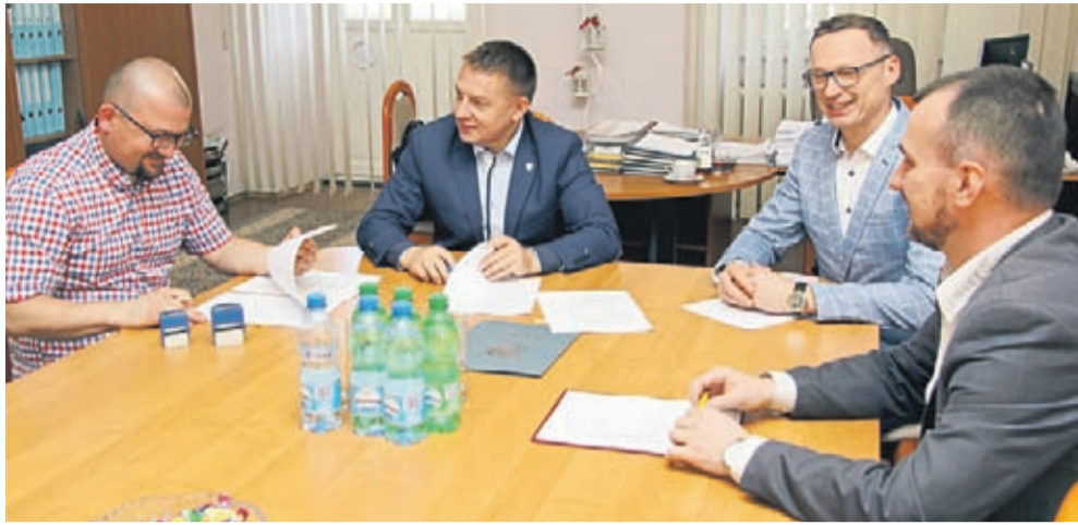
Umowa na budowę dróg wiejskich została zawarta 20 kwietnia br.

Drogi z pełną podbudową i podwójnym utrwaleniem nawierzchni powstaną w 9 miejscowościach – Juszczyźnie, Krynicznie, Kulinie, Cesarzowicach, Bukówku, Ciechowcie, Proszkowie, Przedmościu/Swiętem i Szczepanowie. W Kulinie prace będą podzielone na dwa zadania, a w Cesarzowicach na trzy odcinki dróg. Łączna długość nawierzchni obejmująca