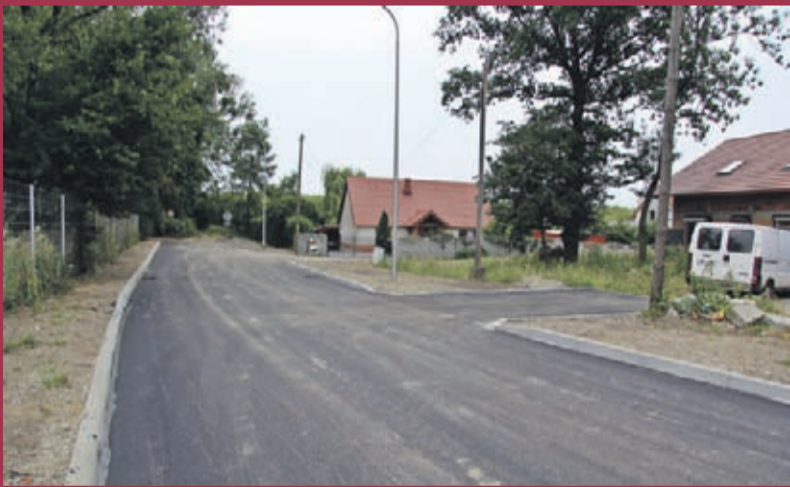
Budowa dróg wiejskich w Chwalimierzu. Wykonawca: „Strabag” Infrastruktura Południe Sp. z o. o. z Wysokiej