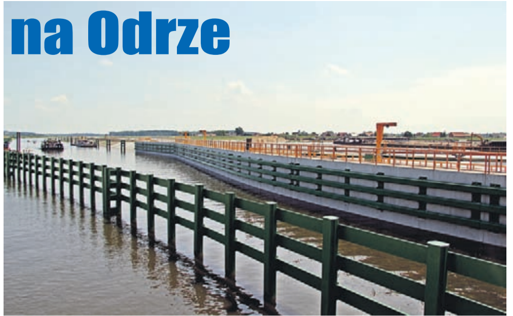
Śluza na stopniu wodnym na Odrze.

– Zakończenie tej inwestycji będzie miało wiele korzyści dla tych terenów położonych w dolinie Odry, także dla Gminy Środa Śląska. Powódź tysiąclecia, która