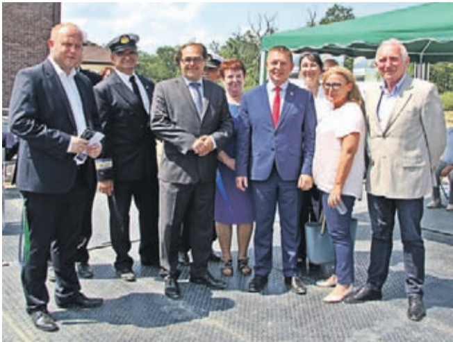
Minister Marek Gróbarczyk i samorządowcy z powiatu średzkiego i wołowskiego.

Budowa stopnia wodnego na Odrze między Rzeczą, a Prawikowem wkroczyła w kolejną fazę. 4 czerwca, w obecności władz rządowych, wojewódzkich i samorządowych, uruchomiono proces śluzowania.