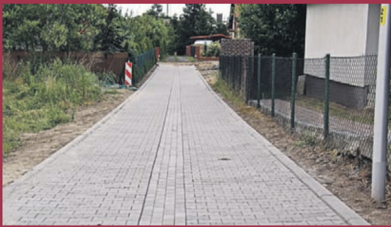
Przebudowa ul. Jastrzębiej w Środzie Śląska. Wykonawca: Zakład instalacyjno-montażowy „Instalator” Sp. c. ze Środy Śląskiej