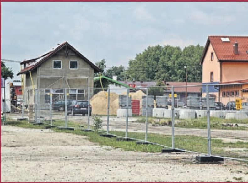
Przebudowa targowiska miejskiego w Środzie Śląskiej. Wykonawca: P&D Przemysław Drabik