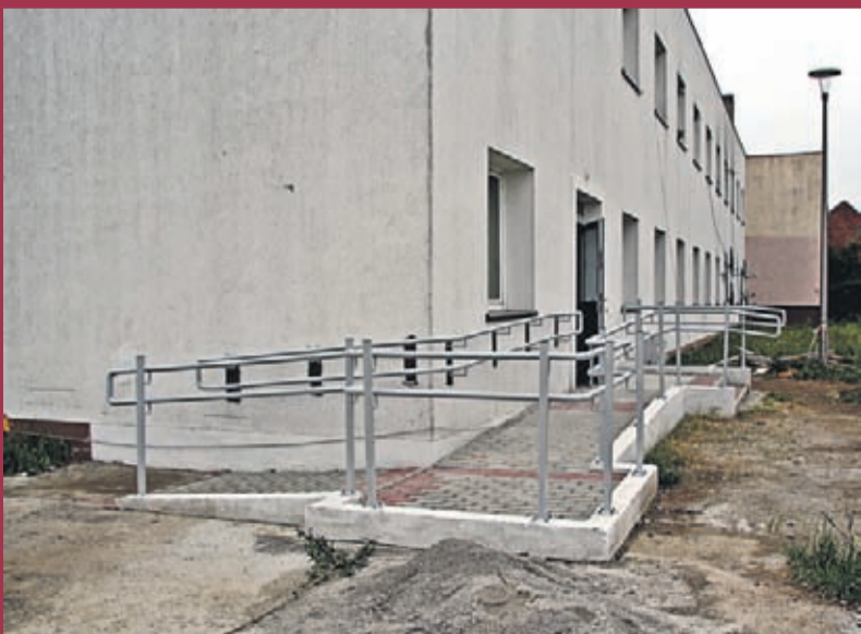
Budowa podjazdu dla osób niepełnosprawnych do świetlicy we Wrocławzicach. Wykonawca: Paweł Rudy „Pabud” Zakład Usług Ogólnobudowlanych w Środzie Śląskiej