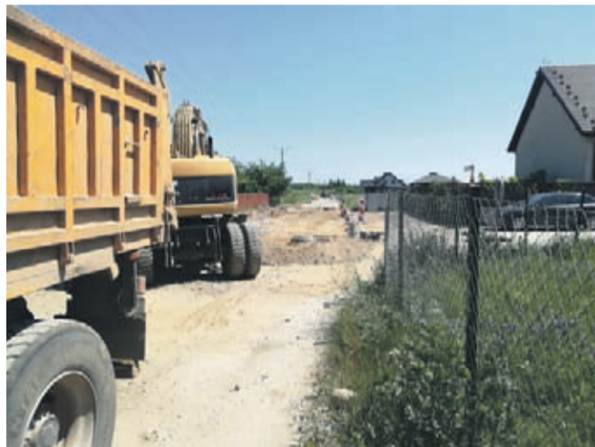
ul. Polna w Lutyni

niu ronda przy miejscowości Kadłub, trwa wykonanie stabilizacji, przełożono sieć średniego napięcia, kontynuowane są prace przy robotach ziemnych i sieci teletechnicznej. Inwestycja jest współfinansowana ze środków Programu rozwoju gminnej i powiatowej infrastruktury drogowej na lata 2016-2019.