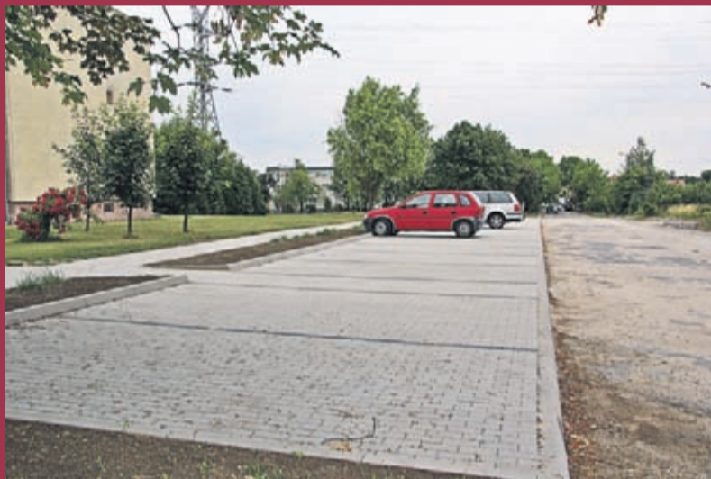
Przebudowa ul. Górnej we wsi Rakoszyce. Wykonawca: konsorcjum Przedsiębiorstwo Usługowo-Produkcyjne i Handlowe „COM-D” Sp. z o. o., Jeleniogórskie Przedsiębiorstwo Robót Drogowych Sp. z o. o.