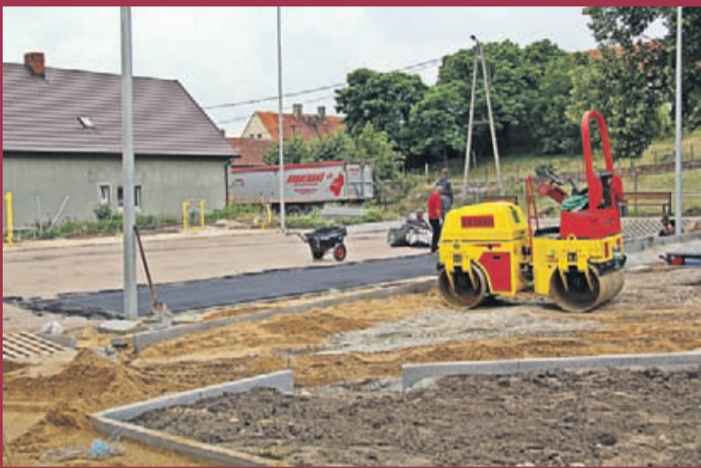
Rewitalizacja przestrzeni publicznej przy świetlicy wiejskiej w Krynicy. Wykonawca: Krzysztof Zieliński, PHI „Zetka” z Góry.