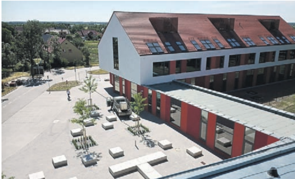
kompleks w Lutyni

Duże postępy widać przy budowie drogi w strefie aktywności gospodarczej Kadłub-Zródła. Obecnie prace koncentrują się na wykona-