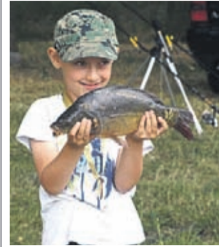
Największa ryba zawodów i jej szczęśliwy łowca.

Trzy dziesiątki dziewcząt i chłopców w wieku młodym, młodszym i jeszcze młodszym, wystartowały 3 czerwca w zawodach wędkarskich z okazji Dnia Dziecka. Rywalizacja odbyła się na akwenu w Wilczkowie (gm. Malczyce), a gospodarzem i głównym organizatorem imprezy było Koło PZW nr 12 z Malczyc