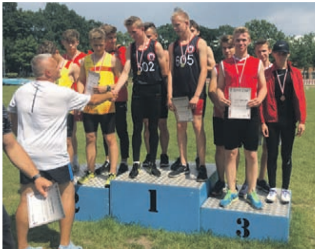
Trzecie miejsce w sztafecie chłopców – strefa.