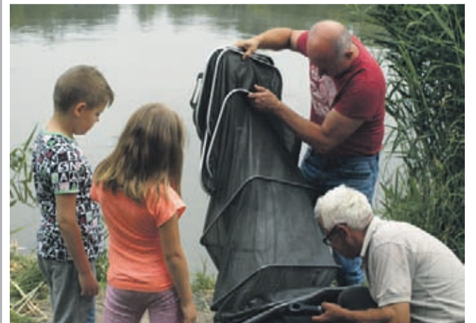
Na pomoc dorosłych młodzi wędkarze mogli liczyć przez całe zawody.