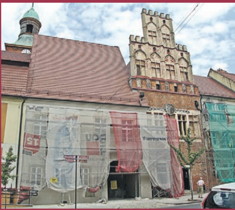
Rewaloryzacja ratusza miejskiego w Środzie Śląskiej. Wykonawca: AGROBUDOVA S.A. z Wrocławia.