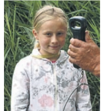
Jeden z wielu dziecięcych uśmiechów tego dnia.

Brak jeszcze, ze względów zrozumiałych, bogatego wędkarskiego doświadczenia młodzi łowcy nadrabiali jak tylko mogli, nierzadko przy fachowym wsparciu doradczym starszego rodzeństwa, rodziców czy innych członków rodziny. Czasami można było odnieść wrażenie, że to dorośli bardziej przezywają każde branie bądź jego brak.