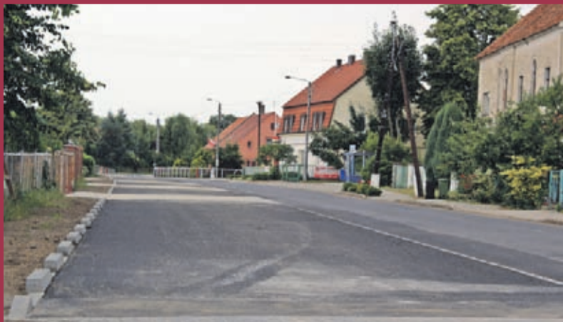
Budowa miejsc postojowych ze zjazdami w Brodnia. Wykonawca: Przedsiębiorstwo Robót Inżynieryjno-drogowych „Kamadex” Sp. z o. o.