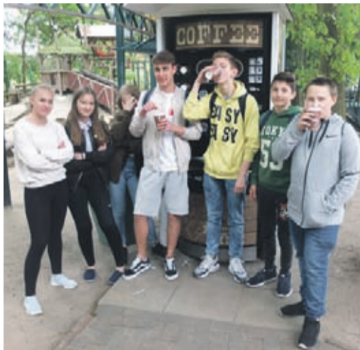
Chwila wytchnienia przy automacie z napojami.