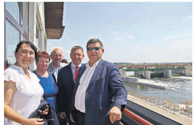
Samorządowcy z ministrem Jerzym Materną na wieży przy stopniu wodnym.