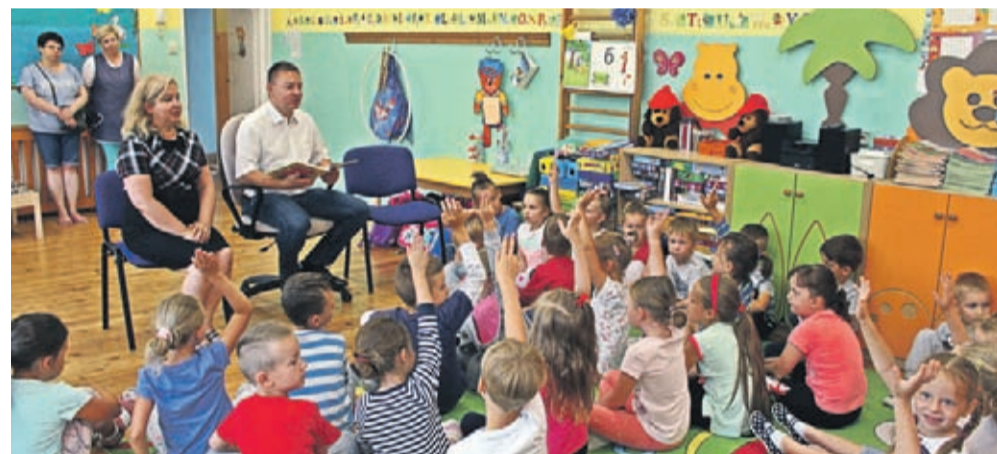
Przedkolaki chętnie słuchają bajek i wierszy.