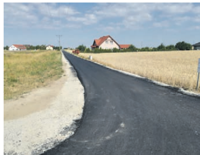
Krępiec ul. Polna

Ponadto w Miękinii przy ul. Letniej, Wiosennej i Jodłowej zakończono prace związane z budową kanalizacji deszczowej i przystąpiono do wykonywania podbudowy pod nawierzchnię dróg.