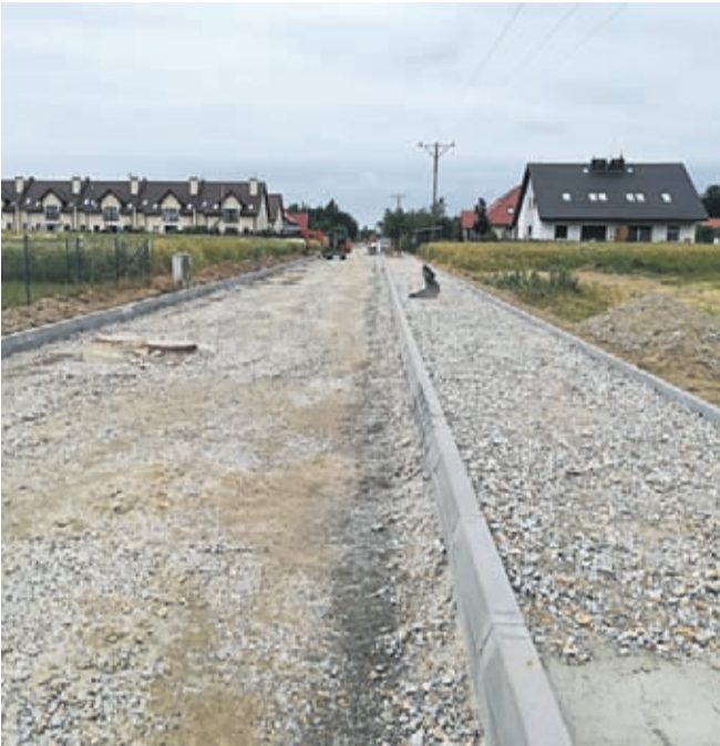
ul. Polna w Lutyni

Kompleks szkolno-przedszkolny już jest, od września jego pomieszczenia wypełni dziecięcy zgiełk i codzienna wrzawa, ale dla władz Gminy Miękinia to nie koniec starań o polepszenie jakości życia mieszkańców.