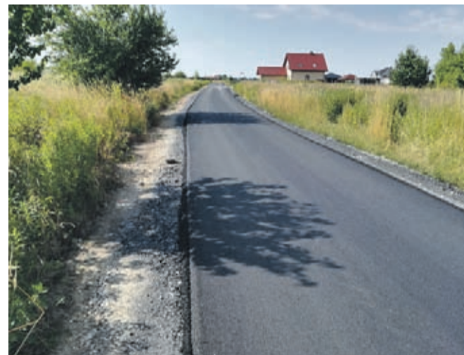
Mrozów ul. Owocowa