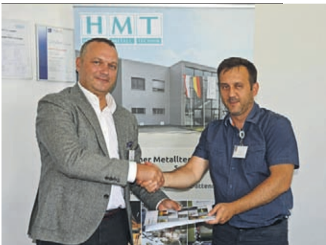
W ramach działań projektowych, w lipcu i sierpniu, dzie-

Powiat Średzki razem z Urzędem Marszałkowskim i Dolnośląskim Ośrodkiem Doskonalenia Nauczycieli realizuje projekt pn. „Zawodowy Dolny Śląsk”.