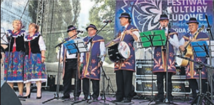
„Tacy sami” z Wrocławia zaprezentowali piosenki ludowe z różnych regionów Polski, a także utwory patriotyczne, biesiadne oraz religijne.