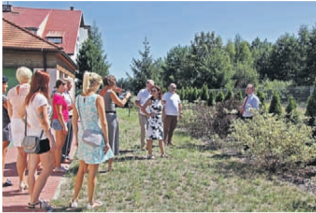
Po spotkaniu rodzice oglądali teren, na którym za kilka miesięcy stanie segment C budynku przedszkola.

Prace nad przygotowaniem tej ważnej inwestycji rozpoczęły