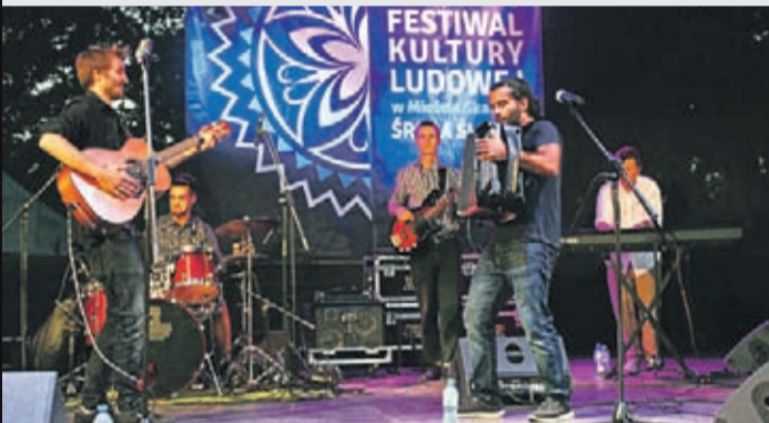
„Marvinca” z Lozanny to muzyczna podróż przez folk, etno, jazz, rock i hip hop