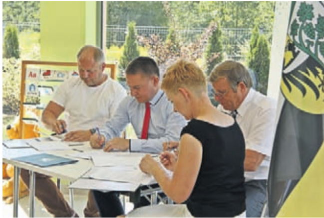
Podpisanie umowy na dobudowę segmentu C do istniejącego budynku Lokalnego Centrum Aktywności Wiejskiej w Szczepanowie.

Dzięki temu grupa dzieci, która w poprzednim roku szkolnym uczęszczała do żłobka, będzie mogła bez przeszkód kontynuować swoją obecność w szczepanowskiej placówce. Jak