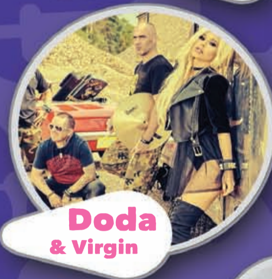
Doda & Virgin