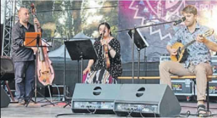
Wykonawcy etnicznych brzmień „Aksak Balkan Trio” z Lublina godnie zastąpili bałkańskie rytmy Kayah&Bregović