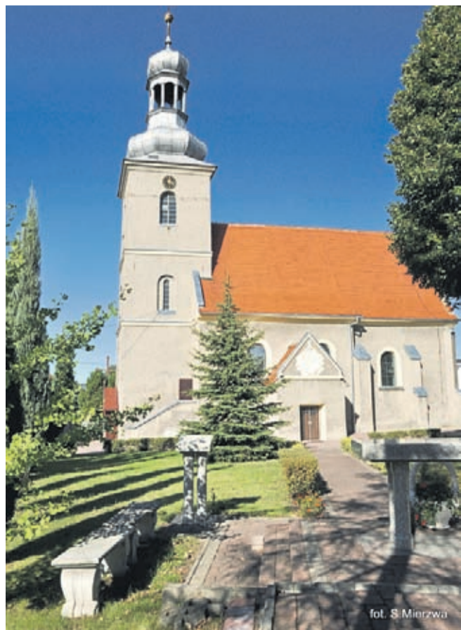
fol. S. Mierzwia