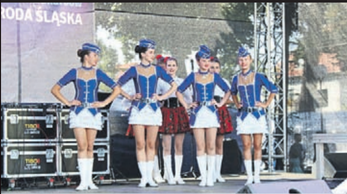
Utalentowane i wielokrotnie nagradzane srebrne medalistki - Mażoretki „Prima” ze Świdnicy nie zawiodły. Zachwyciły swoim profesjonalizmem.