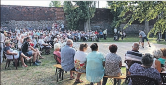
Nieśmiały początek dobrej zabawy „na deskach” w Parku Miejskim.

- Muzyka ludowa, folkowa to nie do końca to, czego słucham na co dzień.