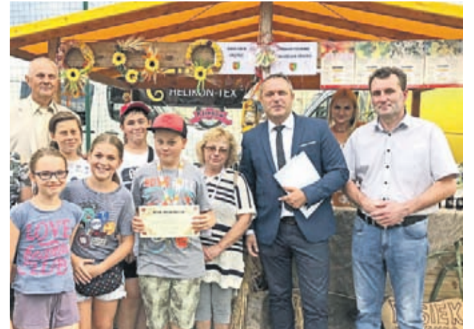
Konkurs na stoisko zainaugurowano podczas Festiwalu Lata w Miękinii

Gmina Malczyce: Chomiąza, Rachów i Wilczków