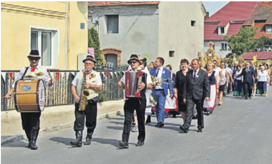
Barwny korowód dożynkowy, wśród wspaniałej i z humorem udekorowanych domów, poprowadzili muzycy z kapeli ludowej „Dolnoślązacy”.