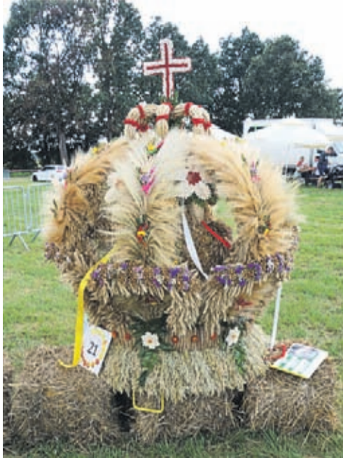
Zwycięzca konkursu 2017

Konkurs na Najciekawsze Stoisko Wiejskie składa się z pięciu odsłon, po jednej w każdej gminie. Powiatowa komisja wyłania i nagradza trzy najciekaw-