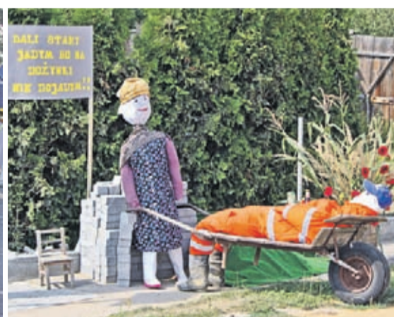
Zabawnie i z pomysłem – tak mieszkańcy Kulina przygotowali swoje domy na uroczystości dożynkowe.