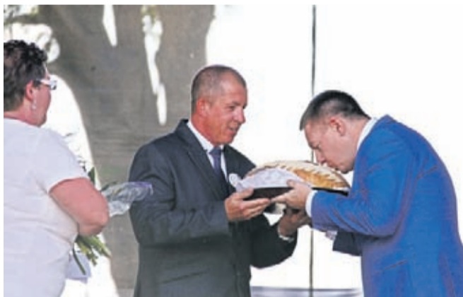
Starosta i Starościna Dożynek przekazali Burmistrzowi Środy Śląskiej specjalnie przygotowany na tę okoliczność bochen chleba. Tradycyjny Obrzęd Dożynkowy poprowadzili gospodarze – kapela ludowa „Kulinianie”. Tuż po nich na scenie zaprezentowali się: kapela podwórkowa „Biesiadni” oraz „Dolnoślązacy” i „Polanie”.