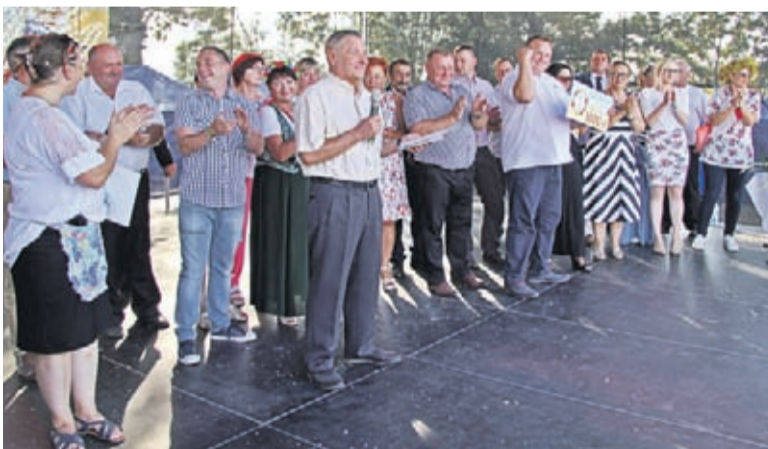
Sołtysi i przedstawiciele sołectw, które wykonały tegoroczne wieńce dożynkowe. Według komisji konkursowej najpiękniejszy był wieńiec przygotowany przez sołectwo Chwalimierz, na II miejscu uplasowały się Rakoszyce, na III Kryniczno, a IV trafiło ex aequo do Wojczyc i Kulina.