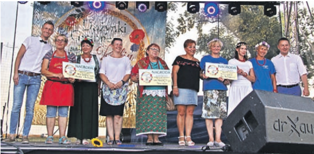
Nagrody finansowe otrzymały również najlepiej przygotowane stoiska dożynkowe. Konkurs wygrało Stowarzyszenie „Mój Szczepanów”, drugie miejsce zajęło Koło Gospodyń Wiejskich z Wrocławowic, a trzecie ex aequo KGW z Michałowic i Przedmościa.