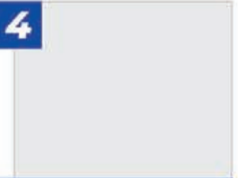
Kzysztof PLESOWICZ Dziwigoń, bezpartyjny