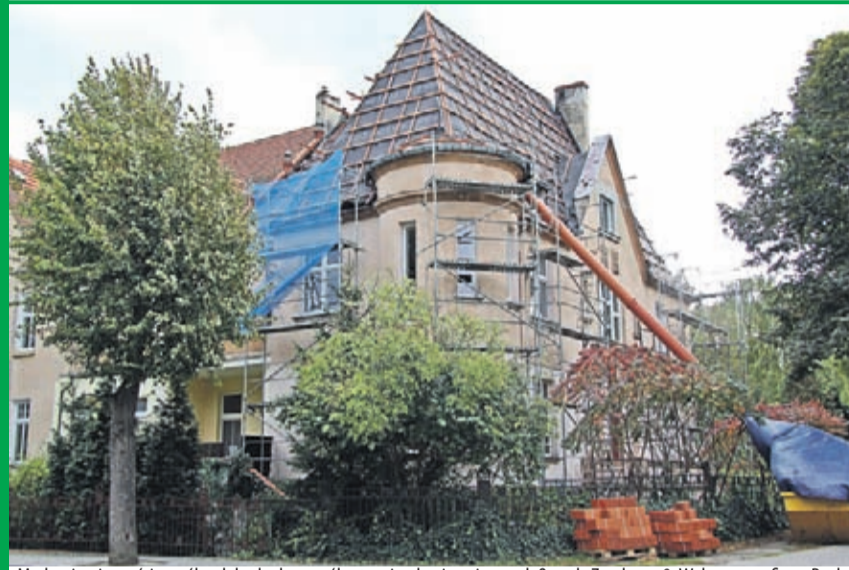
Modernizacja części wspólnych budynku wspólnoty mieszkaniowej przy ul. Ogrody Zamkowe 8. Wykonawca: firma Dach Bud ze Środy Śląskiej.