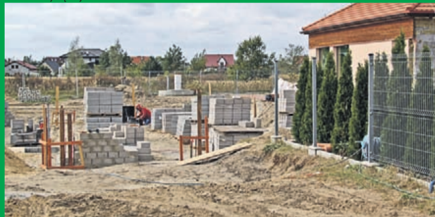
Rozbudowa Przedszkola w Szczepanowie. Wykonawca: Firma El-Sol z Lubszy.