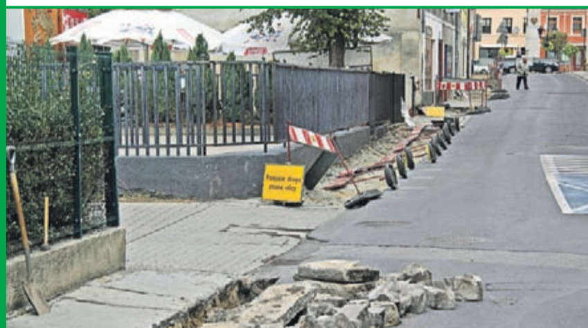
Przebudowa chodników w ciągu ul. Świdnickiej w Środzie Śląskiej - ETAP I. Wykonawca: Polskie Surowce Skalne Sp. z o.o. Grupa Budowlana z Wrocławia.