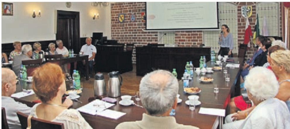
Spotkanie ws. Dziennego Domu Seniora w Sali konferencyjnej UM w Środzie Śląskiej.

DZIENNY DOM SENIORA: - umożliwia osobie starszej dłuższe mieszkanie w swoim domu - zapobiega społecznemu wykluczeniu - zapewnia opiekę dla osób starszych, które w pewnym stopniu utraciły zdolność do samodzielnego funkcjonowania. Osoba starsza przez kilka godzin w ciągu dnia przebywając w Dziennym Domu Opieki otrzymuje zintegrowane wsparcie, czyli różne formy pomocy - zapewnia wsparcie najbliższemu członkowi rodziny w pełnieniu roli głównego opiekuna Dzienne Domy Opieki otwarte są 5 dni w tygodniu (ponie-