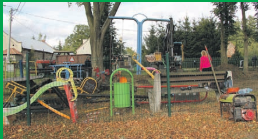
Budowa placu zabaw w miejscowości Święte. Wykonawca: firma Grupa Hydro z Mosiny.