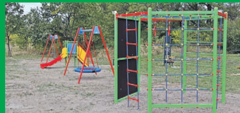
Budowa placu zabaw przy ul. Basztowej w Środzie Śląskiej. Wykonawca: firma Dol-ek z Tarnowa.