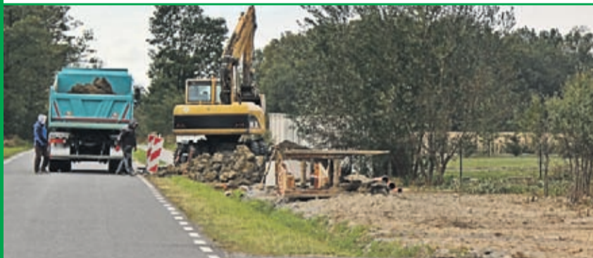
Budowa kanalizacji na Osiedlu Ogrodniczym. Wykonawca: firma HEMIZ-BIS z Prochowic.