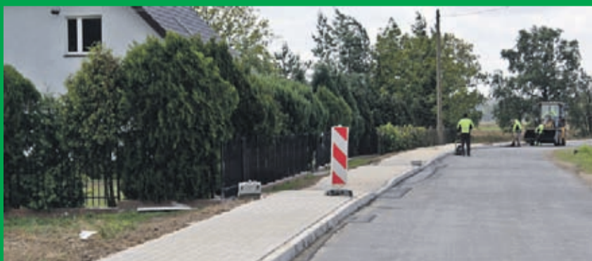
Budowa chodnika w Rzeczycy. Wykonawca: HEMIZ-BIS z Prochowic.