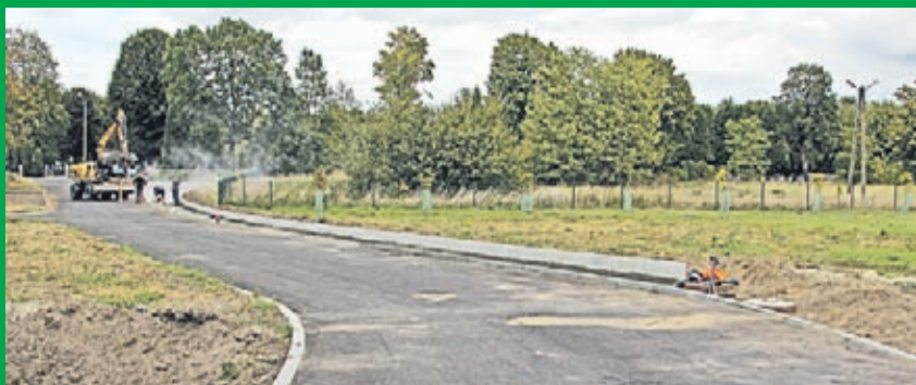
Budowa chodnika przy łączniku ul. Cmentarnej z ul. Wierzbową. Wykonawca: firma Fobis z Lubina