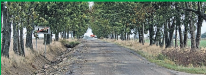
Przebudowa drogi Juszczyń - Wojczyce. Wykonawca: BERGER BAU z Wrocławia.