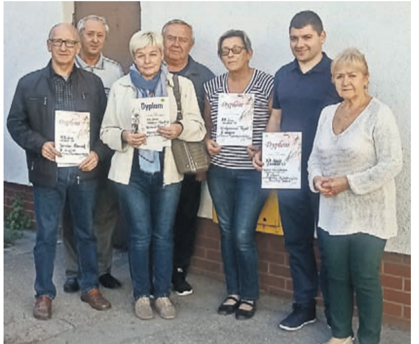
Nagrodzeni działkowcy wraz z Zarządem.