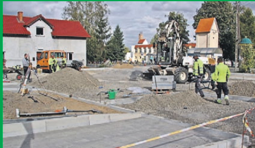
Budowa parkingu przy skrzyżowaniu ulic Średzkiej i Lipnickiej w Szczepanowie. Wykonawca: HEMIZ-BIS z Prochowic.