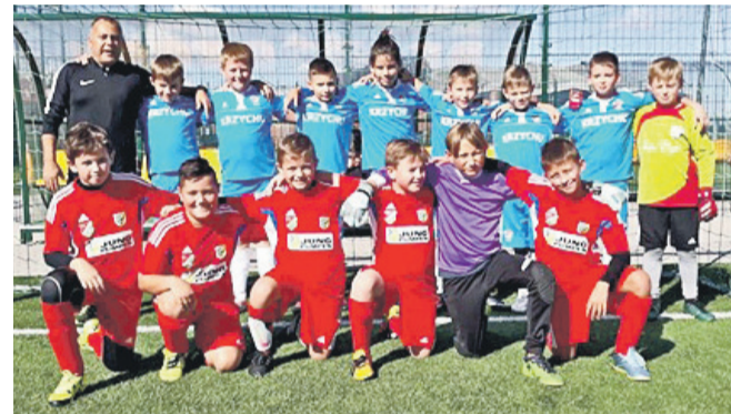
Polonia Środa Śląska