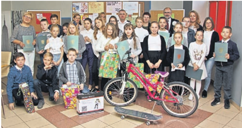
Laureaci konkursu „Stop uzależnieniom”.

Pod takim tytułem odbyła się kolejna edycja konkursu plastycznego organizowanego przez Straż Miejską w Środzie Śląskiej. Konkurs to jeden ze sposobów uwrażliwiania młodych ludzi na problem dotyczący uzależnień.