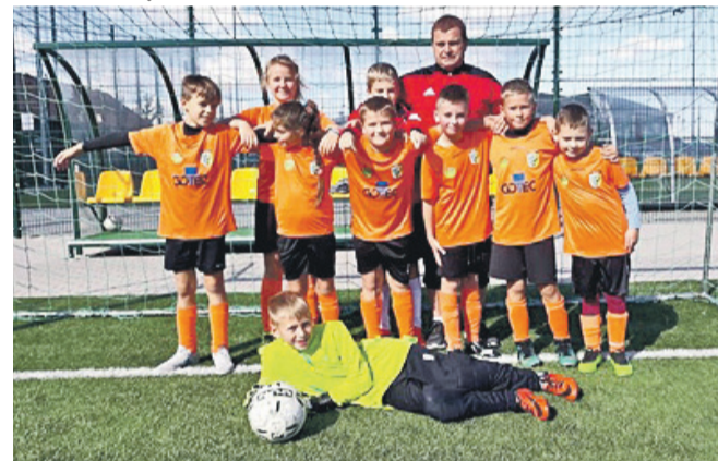
AP LZS Zjednoczeni Szczepanów