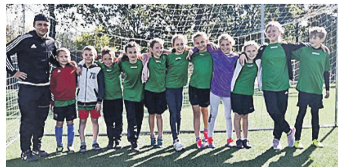
AP LZS Zieloni Rakoszycy