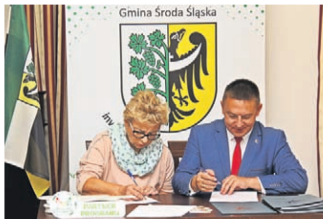
Każdy z Partnerów Programu podpisał porozumienie o współpracy.

Środzie Śląskiej odbyło się podpisanie dokumentów potwierdzających udział przedsiębiorców w programie. Do tej pory z terenu Gminy zgłosiło się 20 podmiotów, które zaoferowały zniżki dla