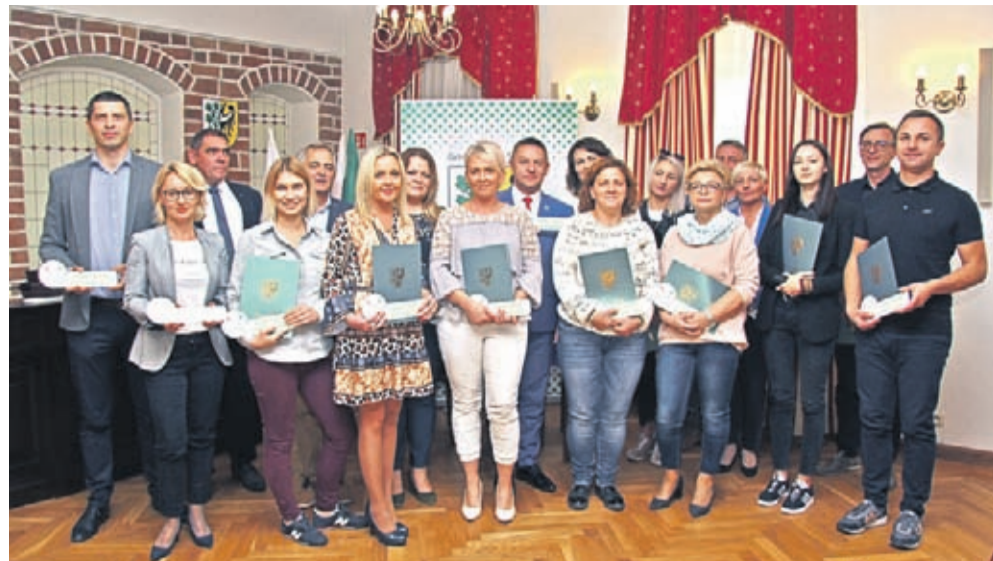
Partnerzy Programu Średzka Karta Dużej Rodziny.

10 października w sali konferencyjnej Urzędu Miejskiego w