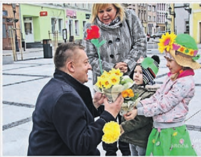
Nie zabrakło kukiełek Marzanny, różnokolorowych kwiatów, gałązek oraz radosnych piosenek i okrzyków „Witaj wiosno!”