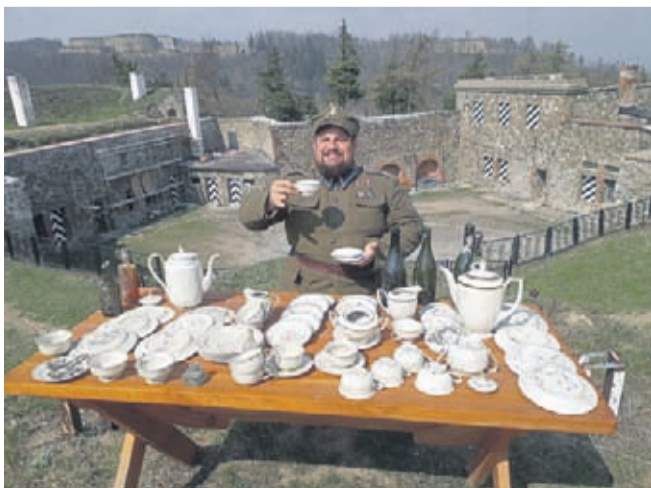
Popołudniowa kawa w takiej filiżance i pięknych okolicznościach przyrody... porcelanowy skarb niemal w komplecie.