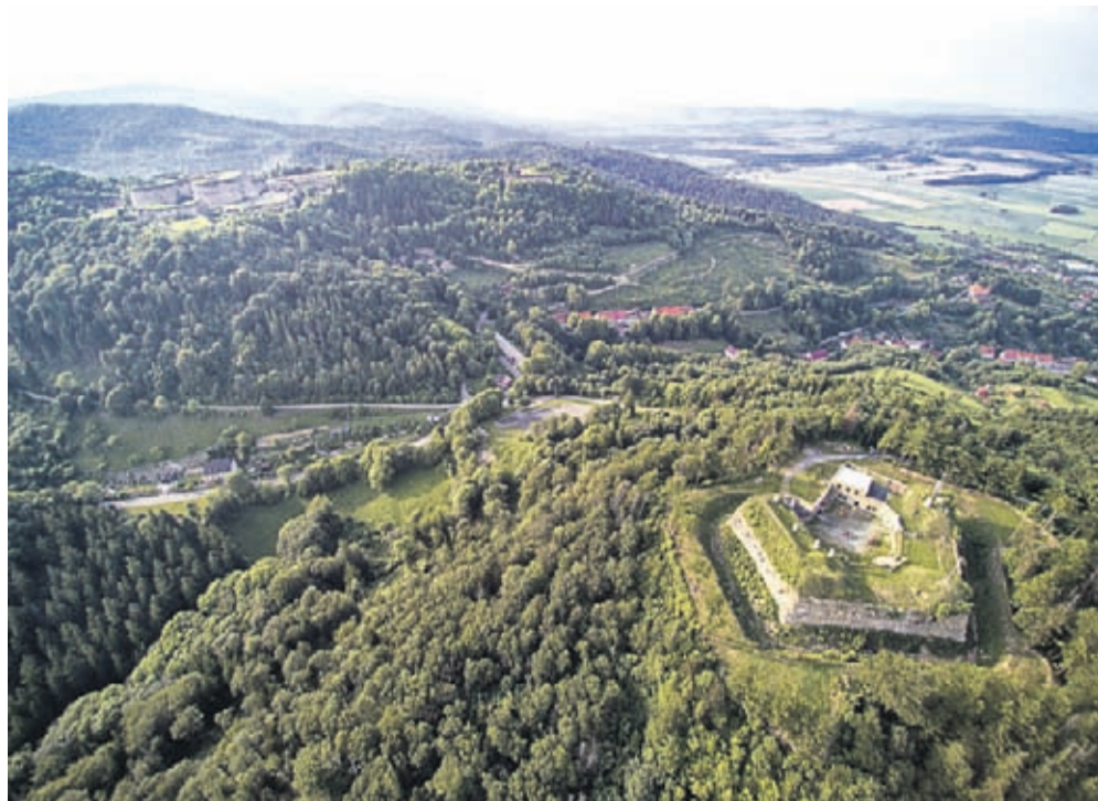
Fort na Spitzbergu powstał w XVIII wieku. Wraz z Donjonem Twierdzy pilnuje przełęczy górskiej i drogi na Dolny Śląsk

no z samodzielnych dzieł obronnych twierdzy srebnogórskiej, wybudowano w XVIII wieku z inicjatywą i pod nadzorem Fryderyka Wielkiego. Obiekt powstał na szczycie góry Ostróg (627 m.n.p) w Górach Bardzkich. Później obiekt pełnił funkcję największego w Niemczech schroniska młodzieżowego, ośrodka szkolenia dla strzelców górskich i bazy szkoleniowej Hitlerjugend. W czasie II wojny światowej w forcie zlokalizowano pierwszy, niemiecki oflag karany dla polskich oficerów- więziono tu między innymi kontradmirała Józefa Unruga, generała Tadeusza Piskora, bohaterów szarży pod Krojantami. Po II wojnie światowej fort pełnił różne funkcje między innymi bazy harcerskiej. XVIII-wieczna forteca, położona na szczycie wzgórza nie miała jednak szczęścia do remontów-prace ograniczono do prac porządkowych. Od stycznia 2018 roku fort ma nowego gospodarza - Muzeum Obrony Wybrzeża, które opiekuje się między innymi Fortem Gerharda w Świnoujściu.