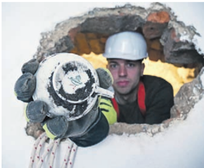
Składnica skarbów - dziura prowadzi do kazamaty, która była niedostępna przez wiele lat i z której pochodzi większość porcelanowego skarbu.