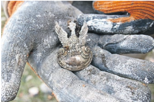
Polski orzełek oficerski pochodzi najprawdopodobniej z czapki jednego z więźniów oflagu.

Nie mniej emocji było w czasie oczyszczania jednej z kazamat. Spośród kilkudziesięciu kilogramów stłuczki porcelanowej udało się skompletować niemal cały komplet przedwojennej, wałbrzyskiej porcelany.