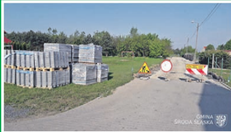
5. Przebudowa ul. Słonecznej w Ciechowie- etap III Wartość inwestycji: 167 500 zł. Wykonawca: „Instalator” s.c. z Środy Śląskiej.