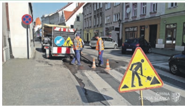
4. Remonty cząstkowe nawierzchni dróg gminnych Wartość umowy: 278 828 zł. Wykonawca: Zakład Budowlano-Drogowy z Żmigrodu.