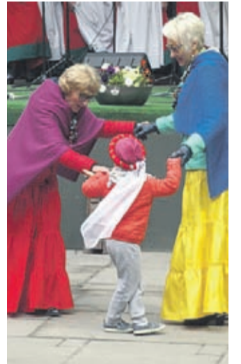
Dobry folklor łączy pokolenia – dobrze się bawią księżniczki małe i duże.

W połączeniu z występami innych artystów, atrakcjami kulinarnymi z regionu i nie tylko i ze specyfiką miejsca, efekt końcowy był bardzo, bardzo OK. Kto był, nie żałował. Kto nie był, może żałować. (j.l.)