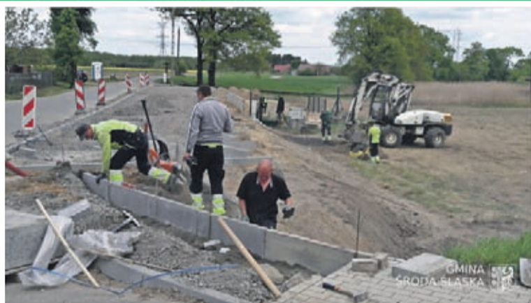
2. Budowa parkingu typu Park & Bike w Brodnie Wartość inwestycji: 175.523 zł. Wykonawca: HEMIZ-BIS Sp z o.o. z Prochowic