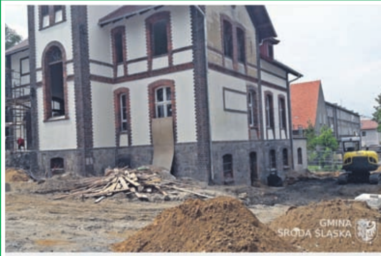
6. Budowa centrum NGO w Środzie Śląskiej Wartość inwestycji: 2.398.146 zł. Wykonawca: P&D w Brzegu Dolnym.