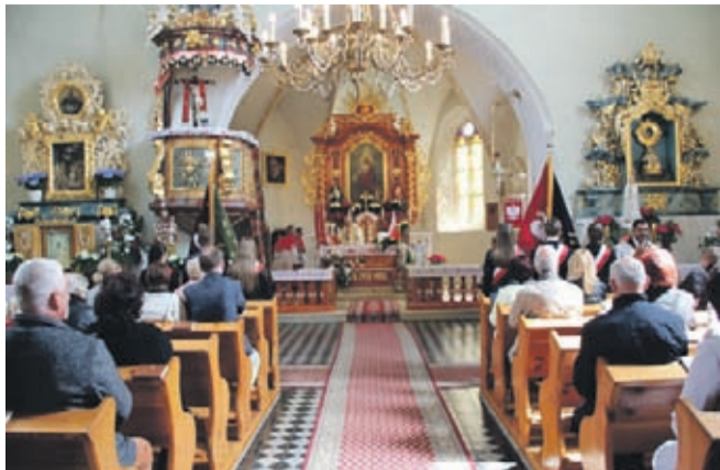
Kluczowym punktem uroczystości był przemarsz na cmentarz w Piotrowicach, gdzie

Z okazji święta Uchwalenia Konstytucji 3 Maja w Piotrowicach spotkali się samorządowcy gminy Kostomłoty – radni, sołtysi, pracownicy urzędu, pracownicy jednostek organizacyjnych, dyrektorzy szkół, poczty sztandarowe szkół podstawowych w Kostomłotach, Karczycach i gimnazjum w Kostomłotach, młodzież i nauczyciele ze szkoły podstawowej w Mieczkowie, przedstawiciele OSP oraz mieszkańcy gminy.