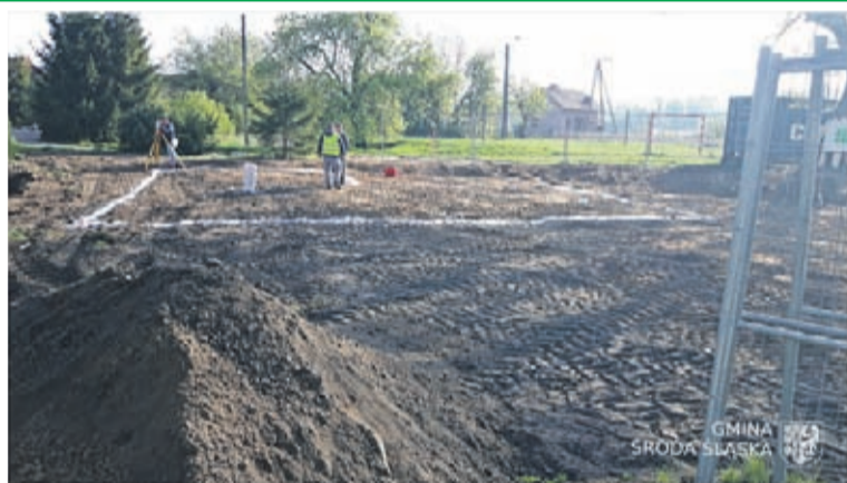
1. Budowa świetlicy wiejskiej w Kobylnikach Wartość inwestycji: 795.381 zł. Wykonawca: EL-SOL INSTALACJE z Lubczy.