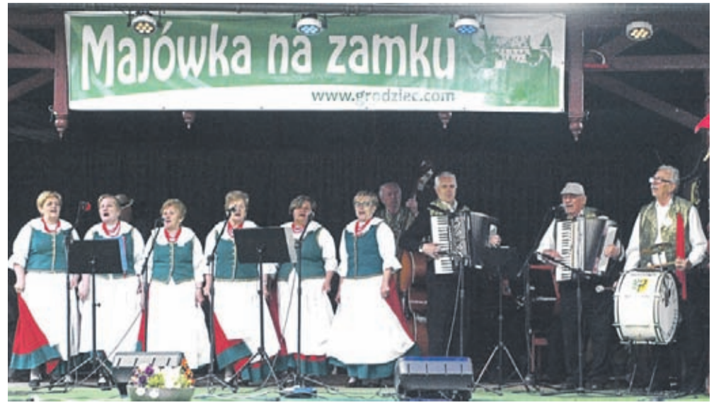
Kulinianie na zamkowej scenie.

Na bardzo różnych scenach grywali już „Kulinianie” z Kulina. Tegoroczny sezon imprez plenerowych rozpoczęli 3 maja – trzeciego dnia majówki na zamku Grodziec koło Złotoryi. Zamkowa scena, choć niewielka, to najlepszy dowód, że w średniowiecznych murach dobrze brzmi chyba każdy muzyczny gatunek.