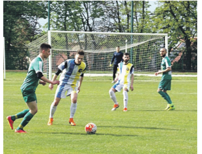
POLONIA ŚRODA ŚLĄSKA - STRZELINIANKA STRZELIN 1:0 (0:0)

Strzelinianka zrywa się w ostatnich minutach do ataków ale obronny pewnie i dowozimy to minimalne zwycięstwo do końca inkasując trzy punkty.