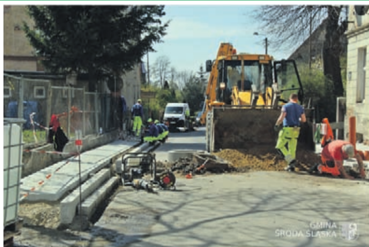
3. Przebudowa chodników przy ul. Świdnickiej- etap II Wartość inwestycji: 358 784 zł. Wykonawca: Polskie Surowce Skalne Sp z o.o. z Bielani Wrocławskich.