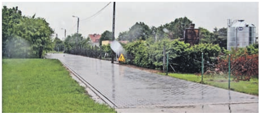
2. Przebudowa ul. Słonecznej w Ciechowie- etap III Wartość inwestycji: 167 500 zł. Wykonawca: „Instalator” s.c. ze Środy Śląskiej.