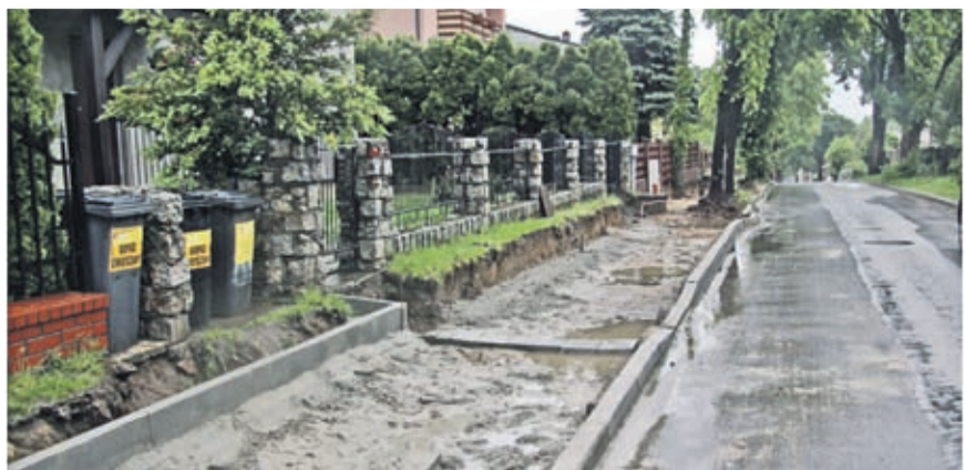
5. Budowa chodnika przy ul. Cmentarnej w Środzie Śląskiej Wartość inwestycji: 134 592 zł. Wykonawca: HEMIZ BIZ Sp z o.o. z Prochowic