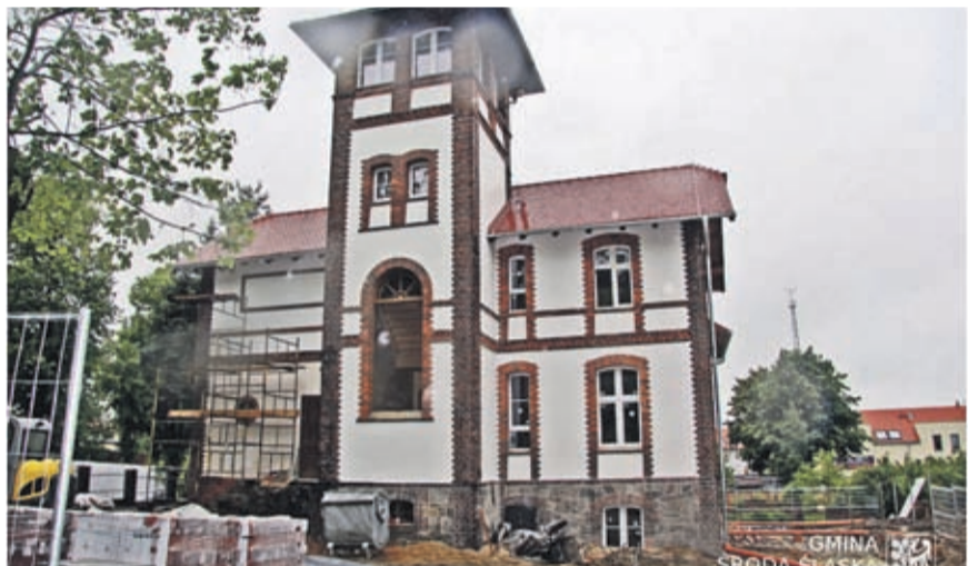
3. Budowa centrum NGO w Środzie Śląskiej Wartość inwestycji: 2.398.146 zł. Wykonawca: P&D