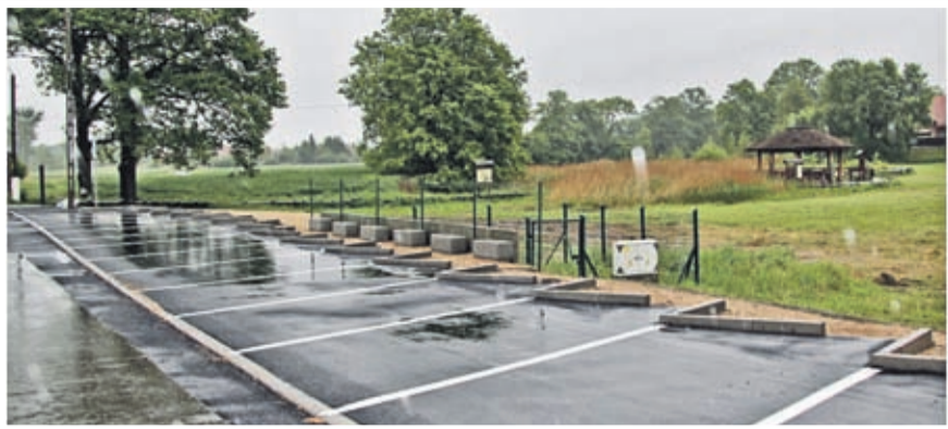
1. Budowa parkingu typu Park& Bike w Brodnie Wartość inwestycji: 175.523 zł. Wykonawca: HEMIZ-BIS Sp z o.o. z Prochowic