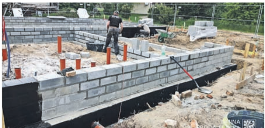
4. Budowa świetlicy wiejskiej w Kobylnikach Wartość inwestycji: 795.381 zł. Wykonawca: EL-SOL INSTALACJE z Lubszy.