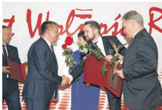
Wręczenie statuetki dla Gminy Środa Śląska

14 czerwca w Warszawie odbyła się Wielka Gala „30 lat Wolności RP”. Uroczystość zgromadziła przedstawicieli władz rządowych, samorządowych oraz przedsiębiorców z wielu branż, którzy swoimi dokonaniem i osiągnięciami wpłynęli na pozycję polskiej gospodarki na świecie oraz, jak w przypadku miast i gmin, wyznaczają poziom i standardy instytucji publicznych w Polsce.