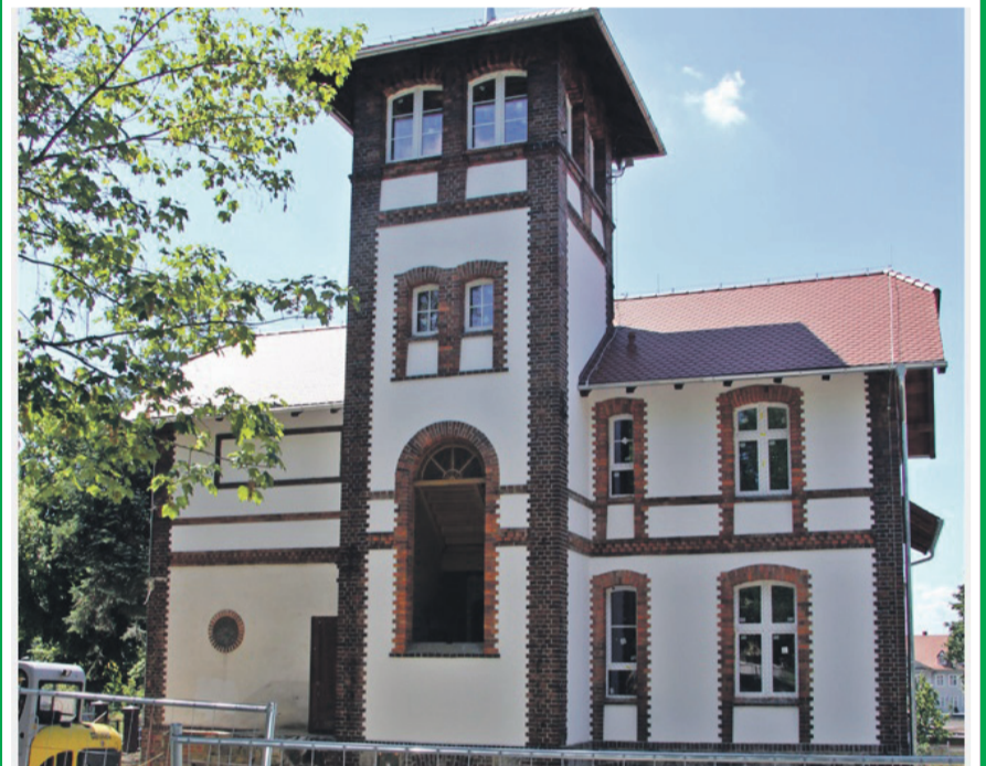
2. Budowa centrum NGO w Środzie Śląskiej Wartość inwestycji: 2.398.146 zł. Wykonawca: P&D