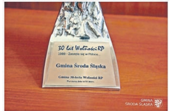
Orle Polskiego Samorządu dla Gminy Środa Śląska

Gmina Środa Śląska to jedno z kilkunastu miast i gmin w Polsce, które zostało nagrodzone tytułem i statuetką Orła Polskiego Samorządu w kategorii Gmina 30-lecia Wolności RP. Ocenie Kapituły Plebiscytu podlegała całość działalności samorządu za poprzednich 30-lat, w tym ostatnie 2-3 lata, za które Gmina Środa Śląska została bardzo wysoko oceniona i uhonorowana statuetką Orła Samorządu oraz tym szczególnym tytułem - Gmina 30-lecia Wolności RP.