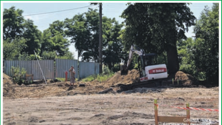
3. Budowa Rakoszyckiego Centrum Czytelnictwa i Kultury Lokalnej w Rakoszycach Wartość inwestycji: 1 490 000 zł. Wykonawca: EL-SOL INSTALACJE z Lubszy.

SERWIS OKIEN I DRZWI PCV • DREWNO • ALUMINIUM NAPRAWA I REGULACJA