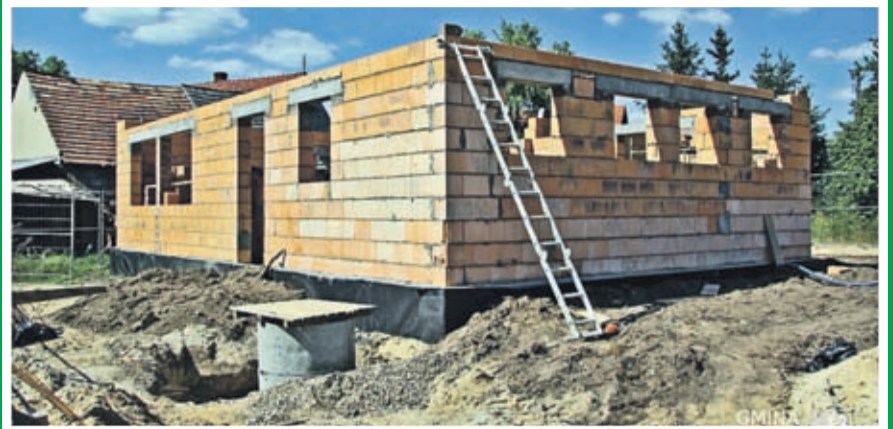
1. Budowa świetlicy wiejskiej w Kobylnikach Wartość inwestycji: 795.381 zł. Wykonawca: EL-SOL INSTALACJE z Lubszy.