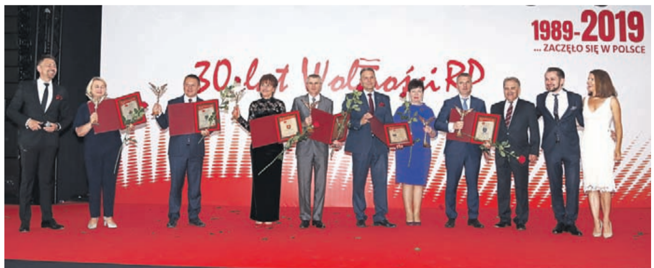
Środa Śląska w gronie liderów polskiego samorządu i gospodarki