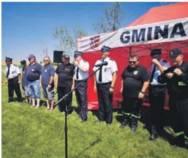
nie gratulujemy życząc dalszych sukcesów.

Gmina Udanin ufundowała puchary, medale oraz poczęstunek w postaci ciepłej grochówki. Wszystkim drużynom serdecz-