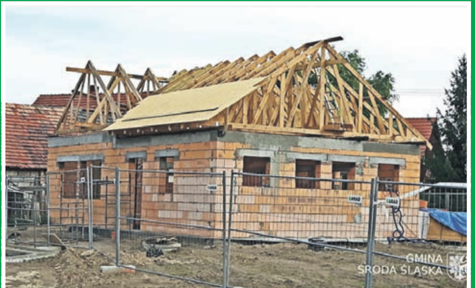
Budowa świetlicy wiejskiej w Kobylnikach Wartość inwestycji: 795.381 zł. Wykonawca: EL-SOL INSTALACJE z Lubczy.