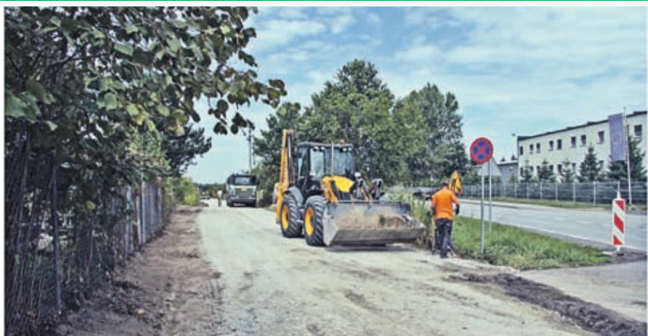
Budowa dróg transportu rolnego ul. Żytnia – część II, zadanie I. Wartość inwestycji: 290 786 zł. Wykonawca: Budromos z Legnicy.