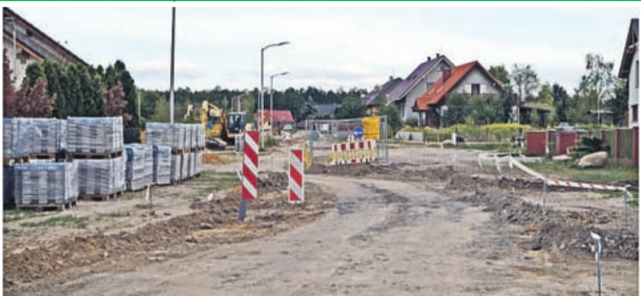
Ciechów – Buczki – etap III - budowa drogi. Wartość inwestycji: 337 239 zł. Wykonawca: Globistic z Pęczy.