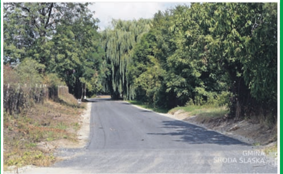
Budowa dróg transportu rolnego – Komorniki ul. Okrężna Wartość inwestycji: 88 190 zł. Wykonawca: Budromos z Legnicy.