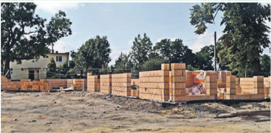
Budowa Rakoszyckiego Centrum Czytelnictwa i Kultury Lokalnej w Rakoszycach Wartość inwestycji: 1 490 000 zł. Wykonawca: EL-SOL INSTALACJE z Lubczy.