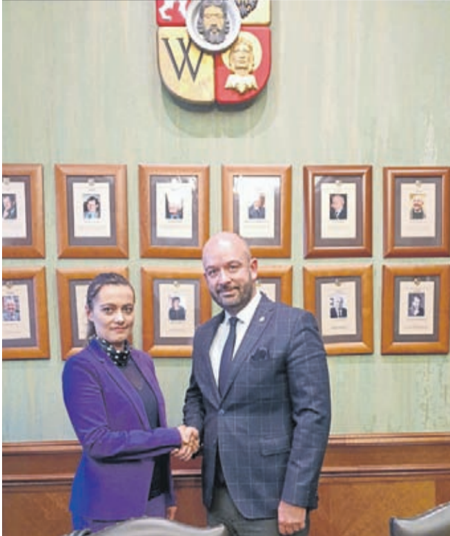
Podziękowanie radnej dla Prezydenta Wrocławia

Niemalże rok trwały rozmowy o przebiegu trasy linii autobusowej nr 923, która przez wiele lat kursowała z Wilkszyna do Leśnicy i została radykalnie zmieniona w lipcu 2019 roku, bez konsultacji z mieszkańcami. Od tego momentu mieszkańcy Wilkszyna i okolic utknęli w korkach przy ulicy Królewieckiej, a wielu z nich zrezygnowało z korzystania z komunikacji publicznej. Odbyło się wiele rozmów, spotkań i wymiany korespondencji w tej ważnej sprawie dla użytkowników linii nr 923.