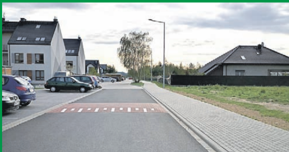
ul. Pogodna w Lutyni_Wróbłowicach po przebudowie