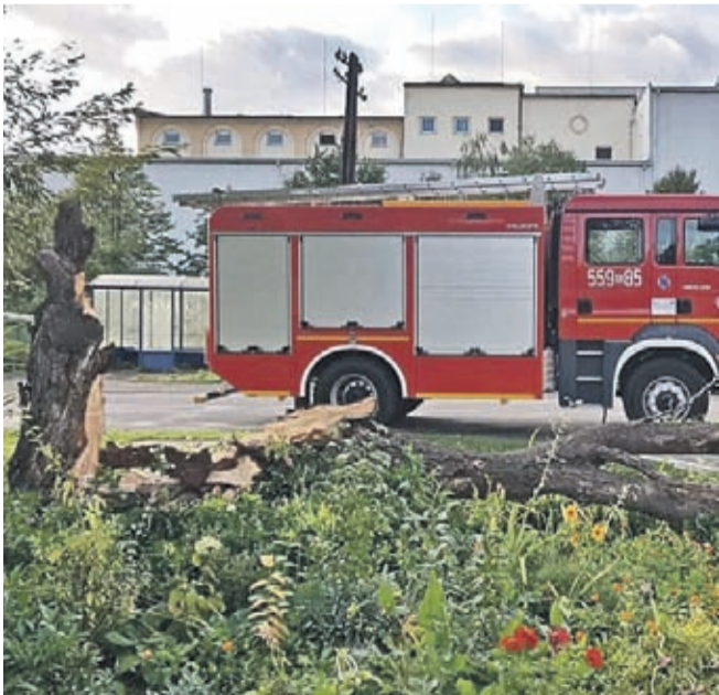
30 września przed godziną 17.00 strażacy OSP KSRG UJAZD GÓRNY zostali zadysponowani do miejscowego zagrożenia związanego z silnym wiatrem w Ujeździe Górnym. Powalone drzewo na szczęście nikomu nie wyrządziło krzywdy. OSP KSRG UJAZD GÓRNY