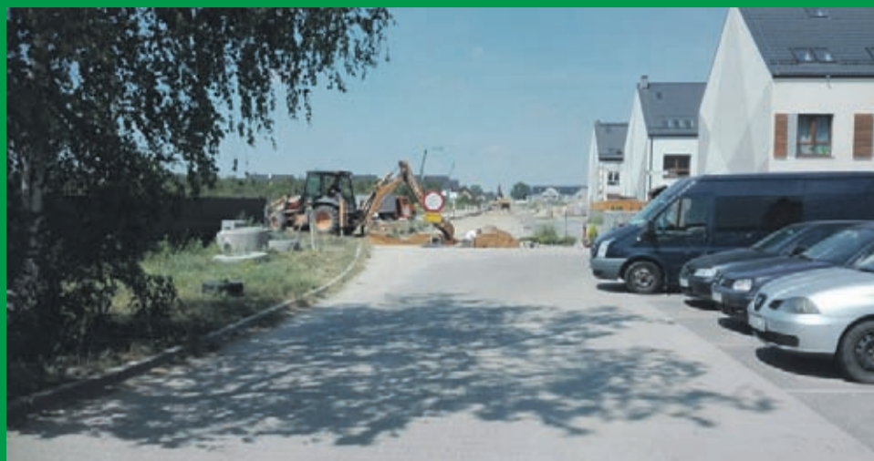
ul. Pogodna w Lutyni_Wróbłowicach w trakcie przebudowy