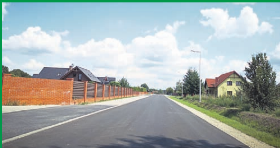
Drogi relacji Białków-Wilkostów-Brzezinka Średzka po przebudowie