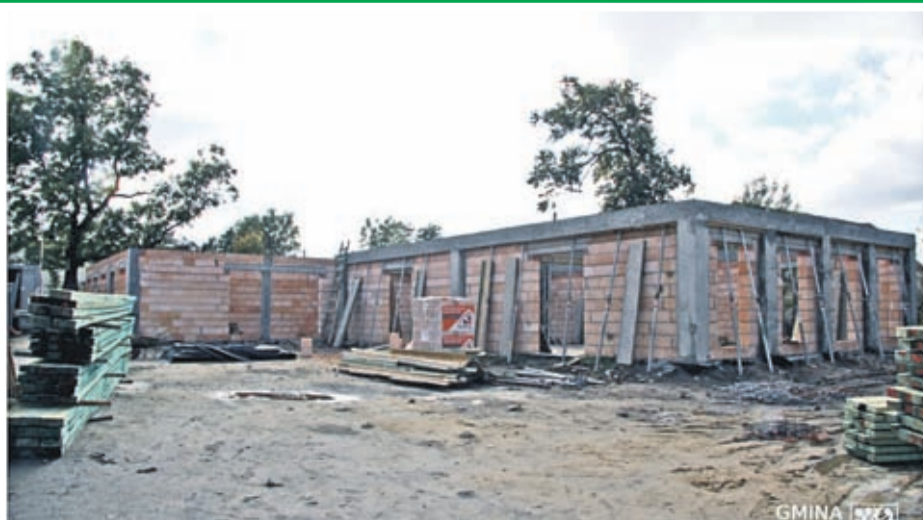
2. Budowa Rakoszyckiego Centrum Czytelnictwa i Kultury Lokalnej w Rakoszycach Wartość inwestycji: 1 490 000 zł. Wykonawca: EL-SOL INSTALACJE z Lubszy.