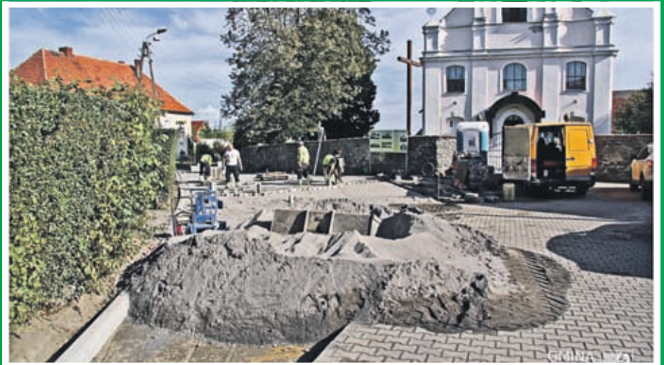
4. Budowa placu i drogi gminnej – ul. Kościelna w Ciechowie Wartość inwestycji: 49 500 zł. Wykonawca: HEMIZ-BIS z Prochowic.