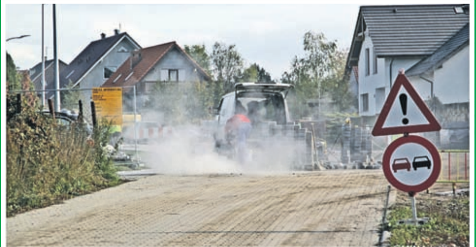
3. Budowa drogi gminnej – ul. Leśna w Ciechowie – etap III. Wartość inwestycji: 337 239 zł. Wykonawca: Globistic z Pęczy.