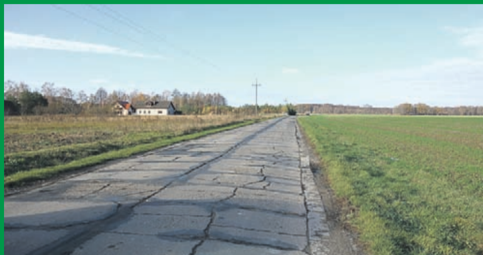
Drogi relacji Białków-Wilkostów-Brzezinka Średzka przed przebudową

Na przebudowę dróg publicznych w 2019 r. do Gminy Miękinia popłynęło w sumie ponad 3,7 mln zł z rządowego Funduszu Dróg Samorządowych, z czego 800 tys. dotyczy przebudowy ulicy Pogodnej w Lutyni/Wróbłowicach, a 2,9 mln zł wsparło przebudowę dróg relacji Białków-Wilkostów-Brzezinka Średzka.