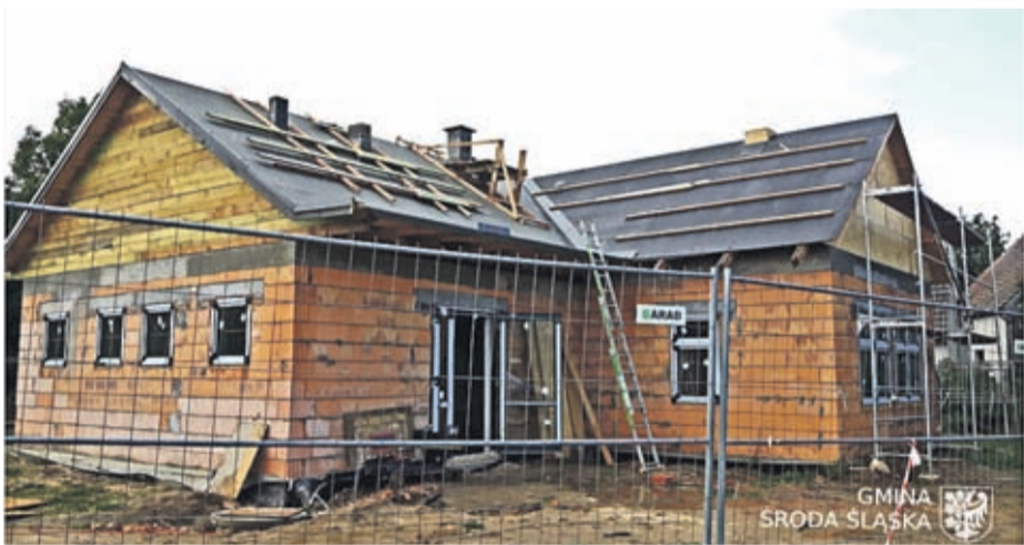
1. Budowa świetlicy wiejskiej w Kobylnikach Wartość inwestycji: 795.381 zł. Wykonawca: EL-SOL INSTALACJE z Lubszy.