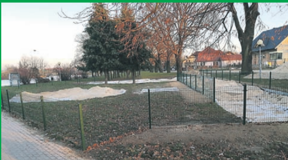
6. Budowa Kreatywnego Placu Zabaw w Śródzie Śląskiej . Wartość inwestycji : 113.400 zł. Wykonawca : Croquet Sp. z o.o. z Mirkowa .