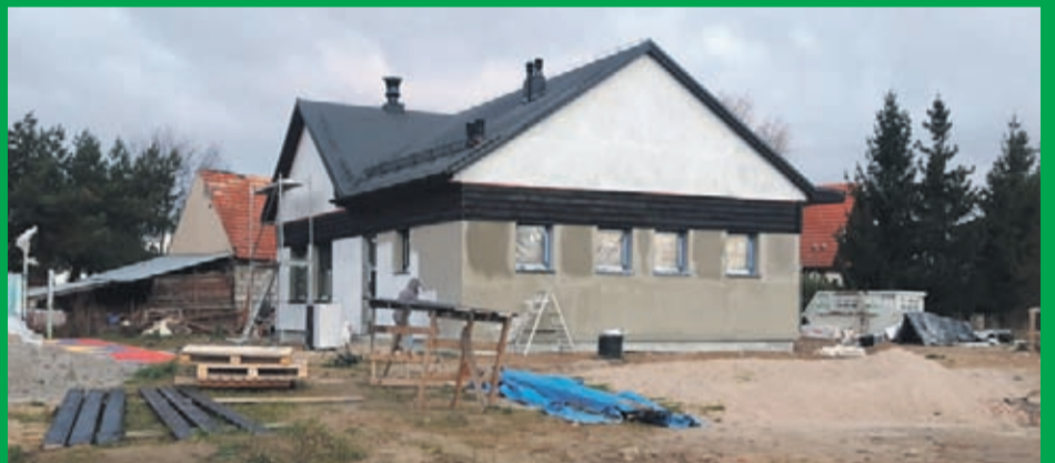
2. Budowa świetlicy wiejskiej w Kobylnikach Wartość inwestycji: 795.381 zł. Wykonawca: EL-SOL INSTALACJE z Lubszy .