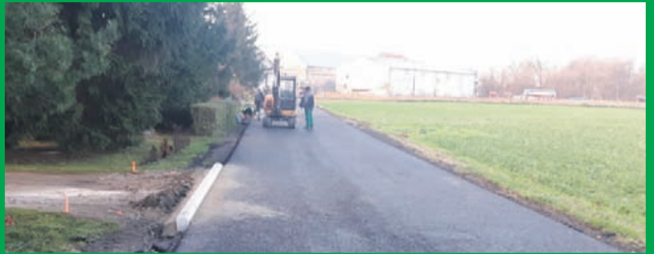
5. Przebudowa drogi gminnej w miejscowości Jugowiec . Wartość inwestycji : 349.551 zł. Wykonawca : Hemiz-Bis. Sp. z o.o. z Prochowic .