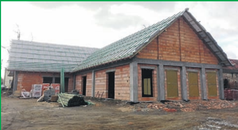
1. Budowa Rakoszyckiego Centrum Czytelnictwa i Kultury Lokalnej w Rakoszycach Wartość inwestycji: 1 490 000 zł. Wykonawca: EL-SOL INSTALACJE z Lubszy