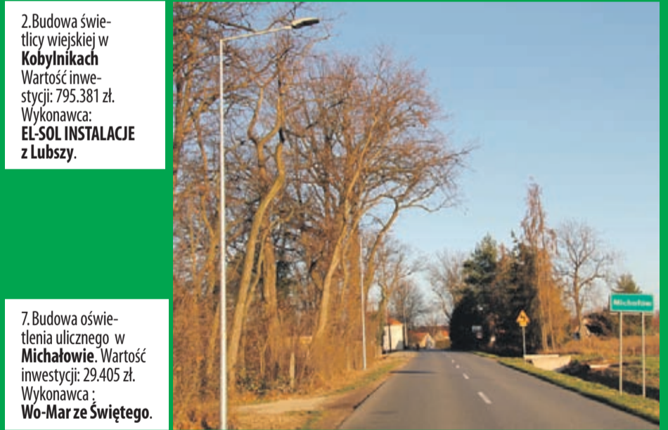
7. Budowa oświetlenia ulicznego w Michałowie . Wartość inwestycji: 29.405 zł. Wykonawca : Wo-Mar ze Świętego .