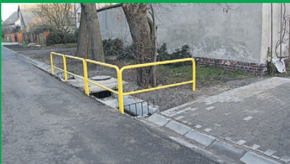
4. Przebudowa wjazdów do posesji oraz wykonanie odwodnienia ciągów drogowych w miejscowości Lipnica . Wartość inwestycji : 241.401 zł. Wykonawca : PBS i M Sp. z o.o. z Legnicy .