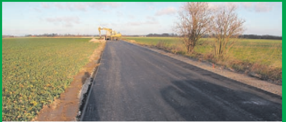
3. Budowa drogi gminnej Ciechów-Ogrodnica . Wartość inwestycji: 887.257 zł. Wykonawca: STRABAG Sp. z o.o. z Pruszkowa .