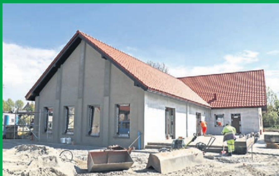
2. Budowa Rakoszyckiego Centrum Czytelnictwa i Kultury Lokalnej w Rakoszycach Wartość inwestycji 2,5 mln zł. Wykonawca EL-SOL INSTALACJE z Lubczy