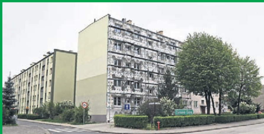
4. Ocieplenie elewacji budynku Wspólnoty Mieszkaniowej w Środzie Śląskiej przy ulicy Legnickiej 31. Wartość inwestycji 115 tys zł. Wykonawca: Franciszek Bartoszek usługi Melioracyjno – Budowlane Środa Śląska