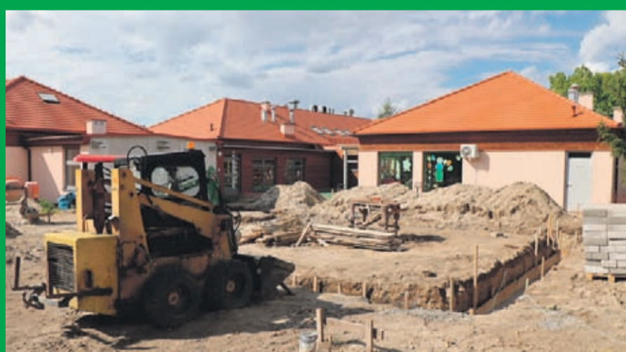
3. Rozbudowa przedszkola w Szczepanowie Etap II Wartość inwestycji 335 tys. zł. (podetap I) Wykonawca EL-SOL INSTALACJE z Lubczy