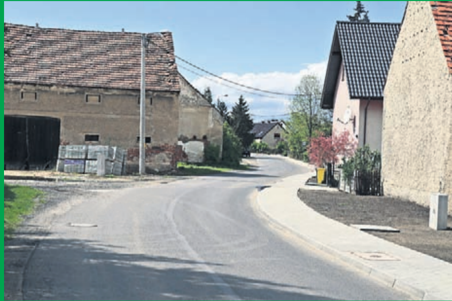
1. Budowa chodnika we Wrocławicach Wartość inwestycji 106 tys zł (po 50 % Powiat i Gmina) Wykonawca: Zakład Instalacyjno-Montażowy INSTALATOR ze Środy Śląskiej