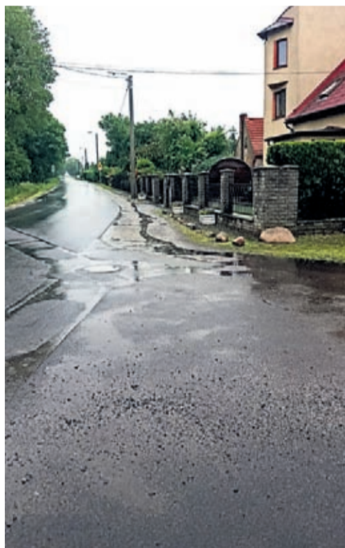
Odcinek objęty budową nowego chodnika w miejscowości Juszczyzn