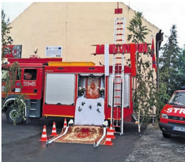
Tak strażacy OSP KSRG UJAZD GÓRNY przygotowali się do obchodów tegorocznego Święta Bożego Ciała.