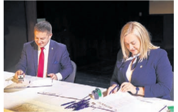
Deklarację podpisują burmistrzowie Strzelina i Środy Śląskiej

Celem wspólnych działań jest opracowanie wspólnej strategii rozwoju jst i przygotowanie się do pozyskania środków unijnych na realizację kluczowych projektów rozwojowych do 2027 roku. Najważniejsze kierunki wspólnej strategii rozwoju gmin i powiatów Subregionu Wrocławskiego to m.in: