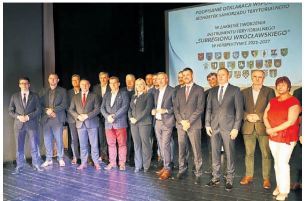
Włodarze gmin i powiatów Subregionu Wrocławskiego