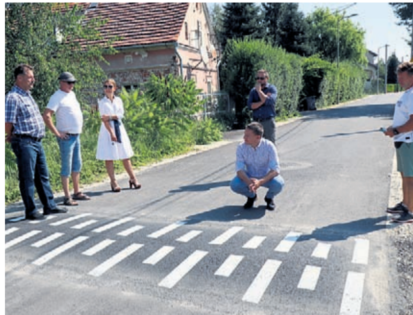
Próg zwalniający na ul. Polnej w Komornikach