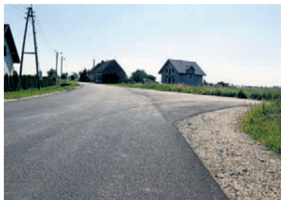
Rozjazd ul. Polnej i ul. Północnej w Komornikach