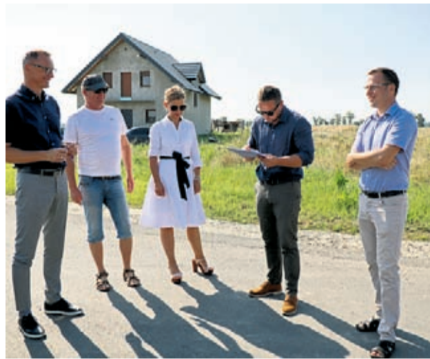
Odbiór drogi asfaltowej w Proszkowie

13 sierpnia przedstawiciele Gminy Środa Śląska odebrali odcinki dróg w Komornikach, Proszkowie i Szczepanowie z nowymi nakładkami asfaltowymi wykonane przez Przedsiębiorstwo Budowy i Utrzymania Dróg i Mostów z Piotroniowic. Łączny koszt nowych nawierzchni asfaltowych finansowany z budżetu Gminy Środa Śląska wyniósł ponad 800 tys. zł.