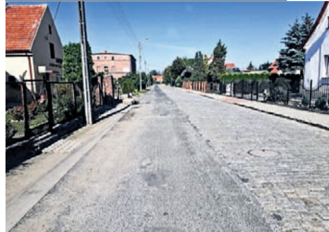
ul. Lipnicka w Szczepanowie

W ramach Funduszu Przeciwdziałania COVID-19 Gmina Środa Śląska otrzymała 1,8 mln zł, jako wsparcie gmin i powiatów w okresie trudnego okresu pandemii. Na sesji Rady Miejskiej 5 sierpnia radni rozdysponowali ponad 1 mln zł ze środków rządowych na 8 inwestycji gminnych.