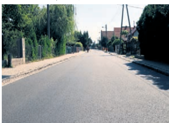
Wyremontowana ul. Długa w Szczepanowie