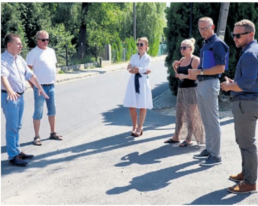
Skrzyżowanie ul. Długiej i Bocznej w Szczepanowie