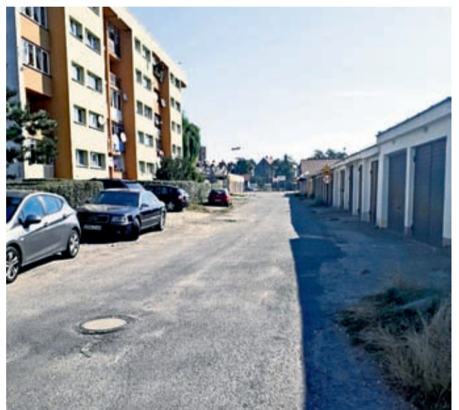
ul. Mostowa w Środzie Śl.