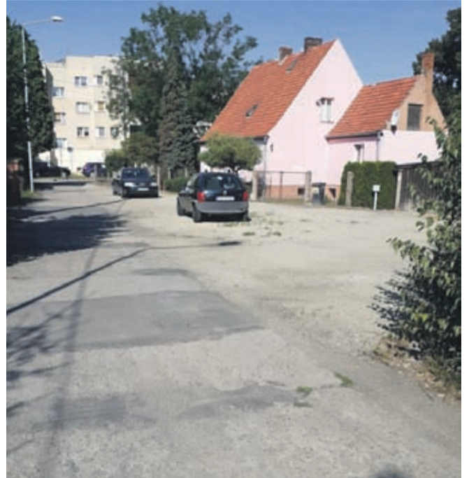
ul. Spacerowa w Środzie Śl.

Rządowy Fundusz Inwestycji Lokalnych to bezzwrotne środki przeznaczone na dotacje dla gmin, powiatów i miast, w wysokości od 0,5 mln zł do aż ponad 93 mln. Łącznie w skali całego kraju aż 6 miliardów złotych, z czego ponad 2,6 mld złotych z Funduszu trafi do gmin wiejskich i miejsko-wiejskich.