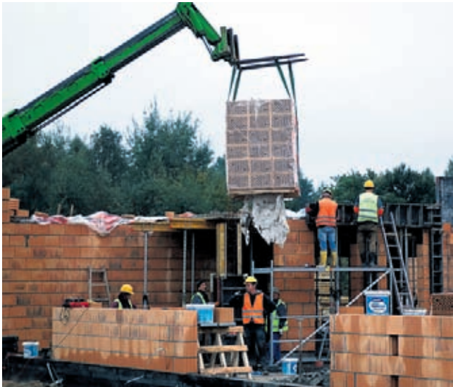
Realizację inwestycji zaplanowano na lata 2020-2021, a nowy żłobek i przedszkole ruszą na początku września 2021 r.