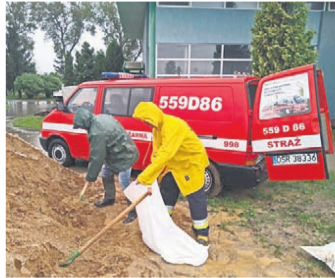
Do zdarzenia udali się zastępem GBA-Rt oraz SLRr. Ich działania polegały na wypompowaniu wody z piwnicy oraz przygotowaniu worków z piaskiem. OSP KSRG UJAZD GÓRNY