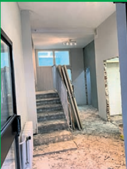
Adaptacja lokalu usługowego przy ul. Dąszyńskiego 16 C w Środzie Śląskiej na Dzienny Dom Seniora Wartość inwestycji: 270 tys. zł. Wykonawca: TORUS z Brzegu Dolnego.