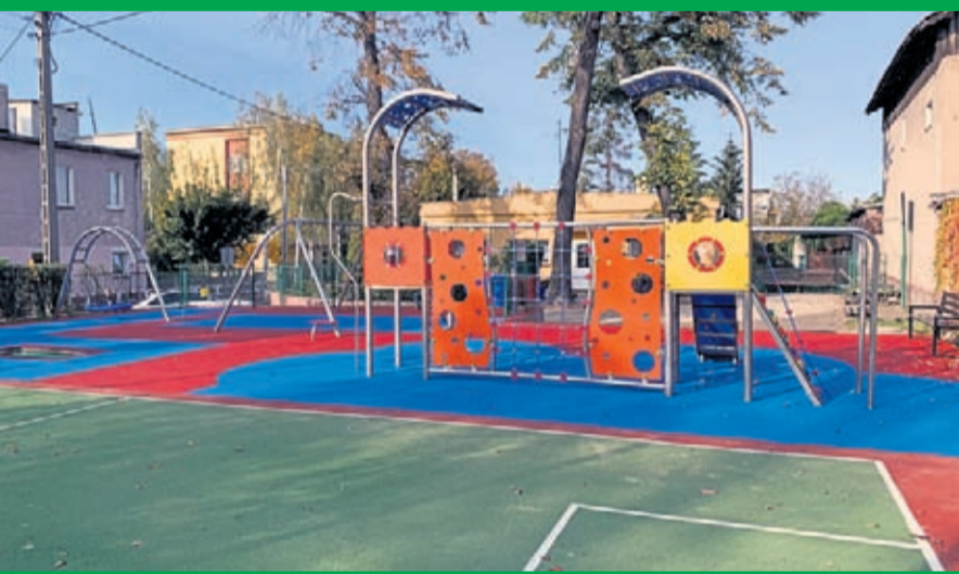
Wykonanie placu zabaw przy Szkole Podstawowej nr 3 w Środzie Śląskiej Wartość inwestycji: 151 tys. zł. Wykonawca: MAGIC GARDEN z Pakość