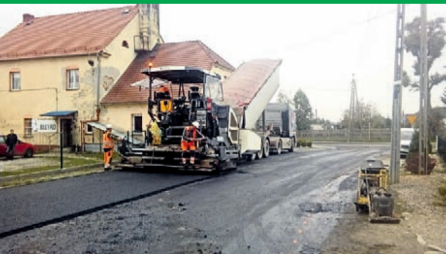
Dokończenie przebudowy drogi gminnej Ogrodnica-Ciechów Wartość inwestycji: 327 tys. zł. Wykonawca: EUROVIA z Kobierzyc