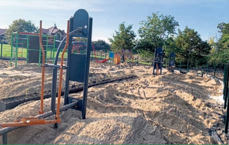
Wykonanie nawierzchni i ogrodzenia placu zabaw przy Al. Basztowej w Środzie Śląskiej Wartość inwestycji: 26 tys. zł. Wykonawca: IGOR-GARDEN z Rzęczyca