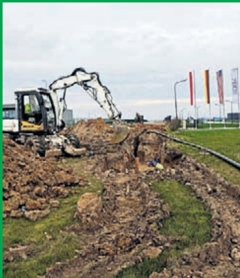
Rozbudowa sieci wodociągowej i kanalizacji sanitarnej na terenie podstrefy LSSE w Świętem Wartość inwestycji: 527 tys. zł. Wykonawca: Hemiz-Bis z Prochowic