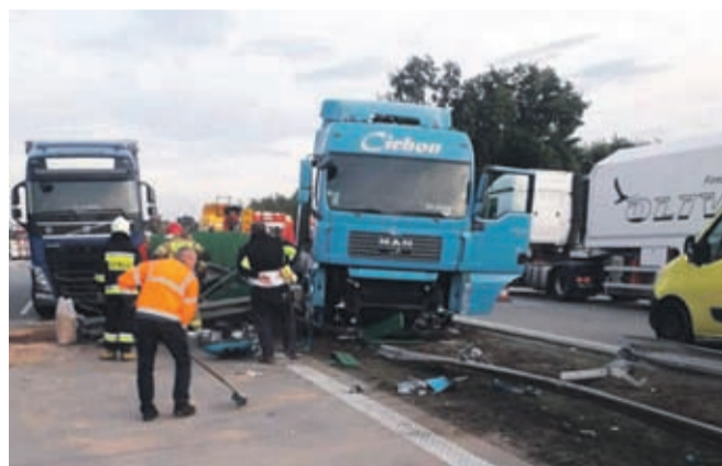
20 października przed godz. 16 strażacy OSP Pichorowice zostali wezwani do pomocy przy usuwaniu skutków kolizji drogowej na 119 km A4 w kierunku Wrocławia.