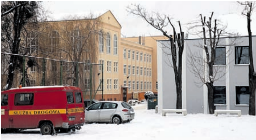
PZS nr 1 oraz pobliskie CeKA

Burmistrz Środy Śląskiej, w związku z wieloma nieprawdziwymi informacjami i zmanipulowanymi komentarzami na profilach Facebook oraz w anonimowych, hejterskich komentarzach na lokalnych portalach internetowych, informuje opinię publiczną o toku procedury dot. zezwolenia na sprzedaż i podawanie napojów alkoholowych w lokalu Sztuka Restaurant przy ul. Przyszkolnej 3.