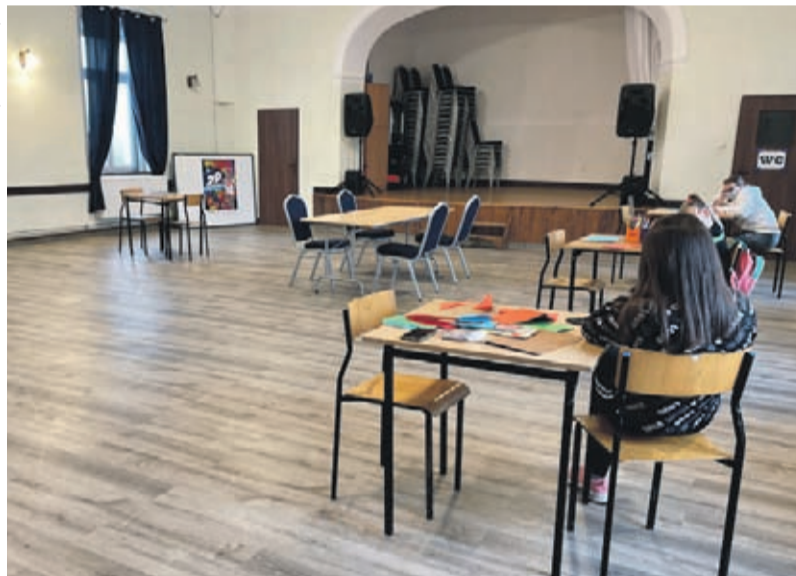
Odnowiona sala świetlicy w Przedmościu

- Większość prac wykonała niezawodna ekipa remontowa DK Środa Śląska – wyjaśnia dyrek-