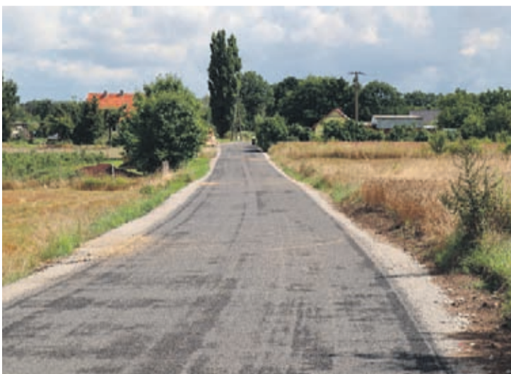
Ukończona droga transportu rolnego w Chwalimierzu