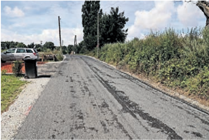
Ukończona droga transportu rolnego w Chwalimierzu

W Chwalimierzu zakończyły się prace związane z budową drogi transportu rolnego. Powstało 562 m odcinka utwardzonego silmentem, prowadzącego do zabudowań jednorodzinnych i zagrodowych oraz terenów rolnych.