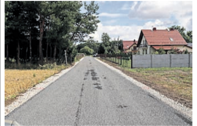
Zakończona droga transportu rolnego w Krynicznie

Zakończyły się prace związane z budową drogi transportu rolnego w Krynicznie. Nowy odcinek powstał w miejscu drogi polnej między zabudowaniami zagrodowymi i prowadzi do terenów rolnych.