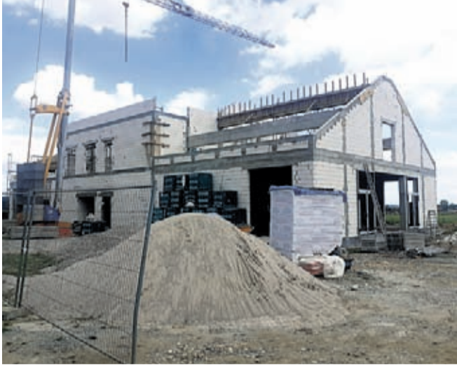
Budowa Inkubatora Przedsiębiorczości w Budzowie, gmina Stoszowice

W podnóży Gór Sowich, nieopodal Stoszowic trwa budowa gminnego inkubatora przedsiębiorczości. To efekt decyzji wójta Pawła Gancarza i radnych Gminy Stoszowice podjętych w 2019 i 2020 roku. Wartość inwestycji Gminy Stoszowice to ponad 5,3 mln zł.