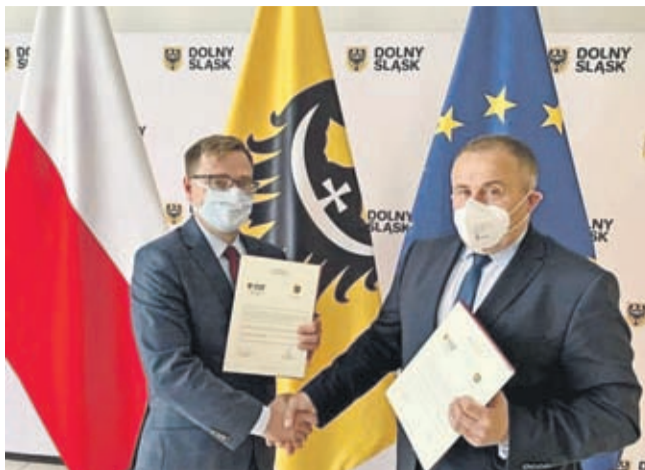
Wszystko po to, aby młodzi ludzie skuteczniej radzili sobie z pojawiającymi się trudnościami życia codziennego.

W ramach działań wspólnych odbędą się specjalne szkolenia/warsztaty dla nauczycieli, którzy będą wykorzystywać nabyte umiejętności i wiedzę z zakresu zdrowia psychicznego w swojej codziennej pracy z uczniami i ich rodzicami.