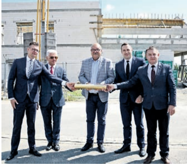
Akt erekcyjny Inkubatora Przedsiębiorczości w Budzowie, gmina Stoszowice