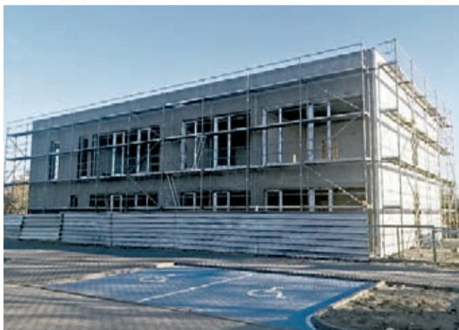
Średzki Inkubator Przedsiębiorczości w budowie