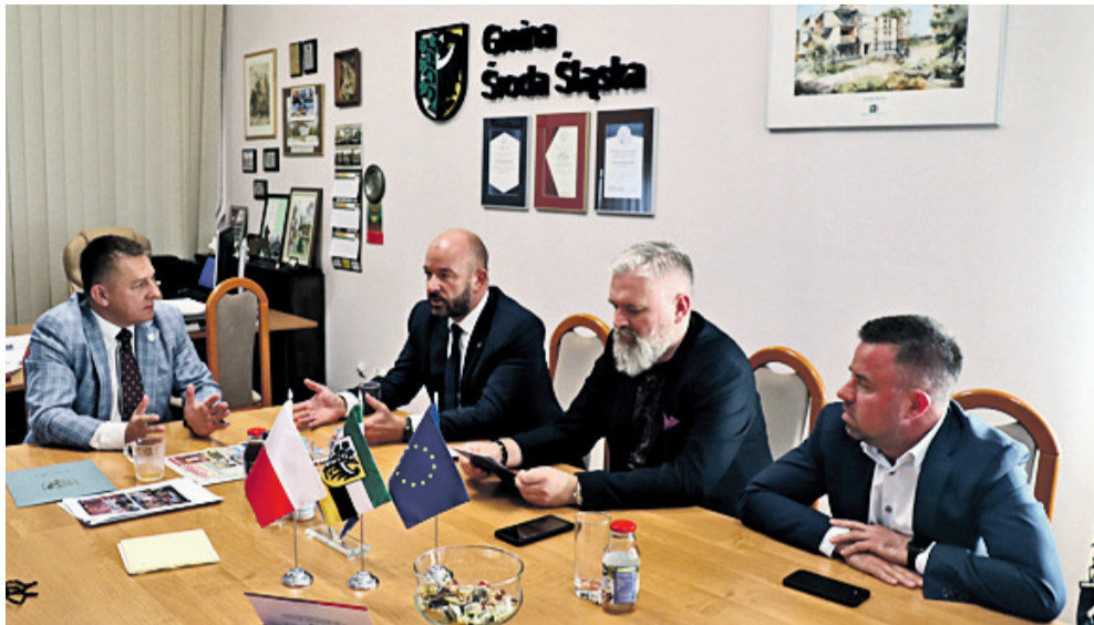
Przedstawiciele Aglomeracji Wrocławskiej podczas spotkania w średzkim UM