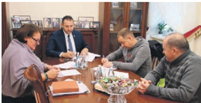
Wartość zadania wyniosła 1.078.629,87zł. Zadanie ma zostać wykonane do 05.12.2021r.

Dolnośląskiego w wysokości 620 130,00 zł w ramach ochrony, rekultywacji i poprawy jakości gruntów rolnych.