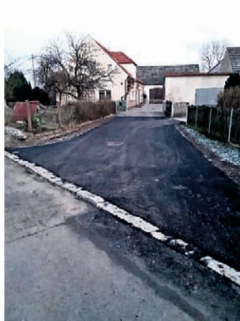
Drogi dojazdowe do posesji w sołectwie Rzeczyca