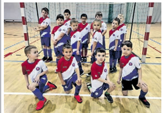
KS „SKARBY” ŚRODA ŚLĄSKA

Bardzo cieszymy się z tej współpracy - teraz organizacja turniejów będzie jeszcze sprawniejsza.