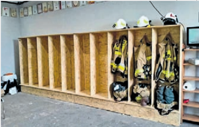
OSP Ujazd Dolny

Prace modernizacyjne remizy strażaków OSP Ujazd Dolny zaplanowane na 2021 rok z lekkim opóźnieniem dobiegają końca, a już przed nimi nowe wyzwania na rok 2022 - w planach termomodernizacja jednostki.