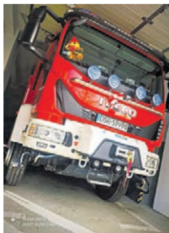
OSP KSRG UDANIN

gów, połączoną z zdobywaniem wiedzy oraz wiele innych atrakcji.