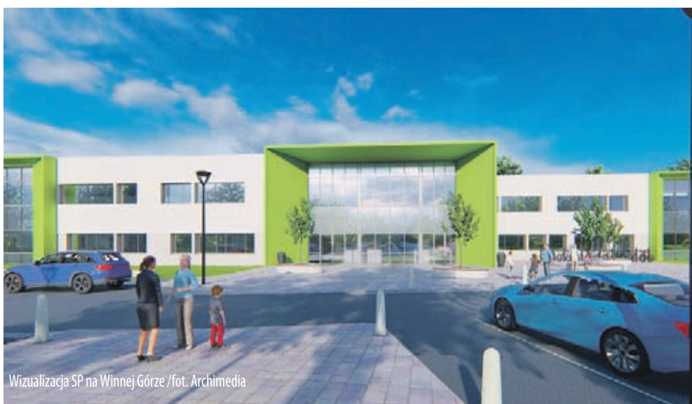
Wizualizacja SP na Winnej Górze

17 lutego burmistrz podpisał umowę z właścicielem firmy PROBUDEX z Wrocławia na usługę pełnienia nadzoru inwestorskiego nad budową nowej Szkoły Podstawowej na Winnej Górze.