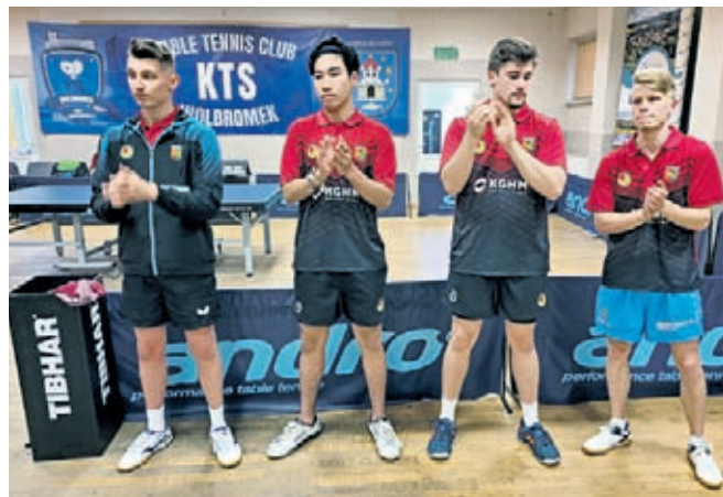
LKS ODRA GŁOSKA

12 miejsce i 70,83% w rankingu wg. punktów i 14 miejsce wg skuteczności Zwyciężył 54 sety, przegrał 29 Zdobył 23 punkty dla drużyny - 17 zwycięstw i 7 porażek