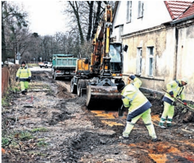
Na części ulicy powstanie nowa nawierzchnia asfaltowa.

Na ul. Kasztanowej rozpoczęła się rewitalizacja zabytkowej nawierzchni z kostki granitowej wraz z budową pobocza. Dla kierowców wyznaczono objazd przez ul. Żytnią i ul. Do Termatu. Prace potrwać do końca kwietnia.