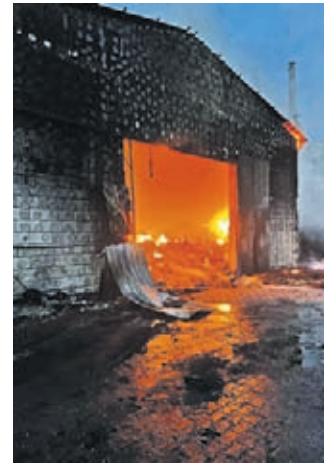
OSP BUKÓWEK / POL

do głównego natarcia na miejsce pożaru oraz dwukrotnie do dozoru i przelewania pogorzeliska. Również zastęp GLBA 0,4/1 Mitsubishi brał udział w działaniach, organizując punkty poboru wody dla jednostek spoza terenu powiatu średzkiego.