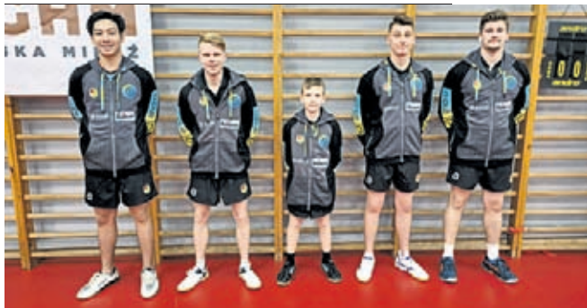
NAJLEPSZA DRUŻYNA: LKS ODRA GŁOSKA

Podsumowanie 1 rundy rozgrywek 2 ligi Dolnośląsko-Lubuskiej Tenisa Stołowego