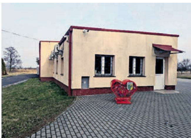
Kamera na świetlicy w Jastrzębcach