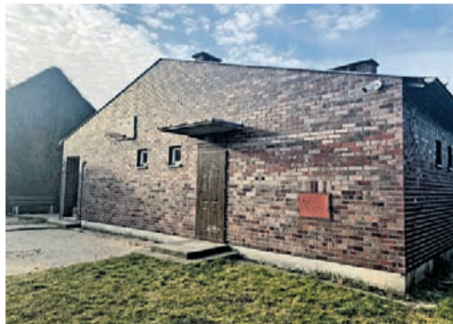
Kamera na świetlicy w Pęczkowie