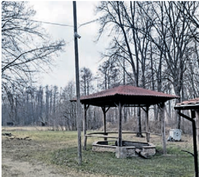
Nowa kamera w parku w Cesarzowicach