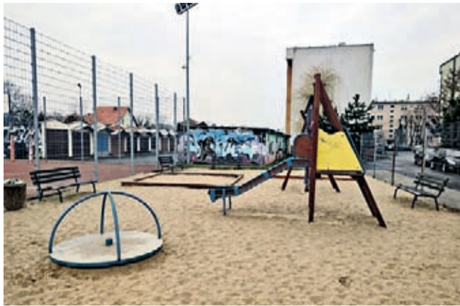
Renowację przejdzie plac zabaw przy Orliku na ul. Mostowej

Ponadto, wkrótce ogłoszony zostanie przetarg na doposażanie placów zabaw i budowę nowych zestawów zabawowych i siłowni plenerowych na terenie miasta i gminy. Powstanie m.in. nowy zestaw zabawowy przy ul. Lipowej w Środzie Śląskiej. Doposażone będą place zabaw w Proszkowie, Wrocisławicach, a w Chwalimierzu przy boisku powstanie siłownia plenerowa. W Komornikach przy placu zabaw obok świetlicy zamontowane będzie linarium. Doposażony będzie plac zabaw w Rzeczycy i Szczepanowie, gdzie na placu zabaw przy boisku ustawiony będzie nowy zestaw zabawowy.