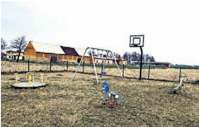
Odnowiony będzie plac zabaw w Juszczynie

Na placach zabaw na terenie miasta i gminy Środa Śląska rozpoczęły się prace renowacyjne. Urządzenia zabawowe zostaną naprawione i odmalowane, a niektóre place zabaw będą doposażane w nowe zabawki i elementy siłowni plenerowej.