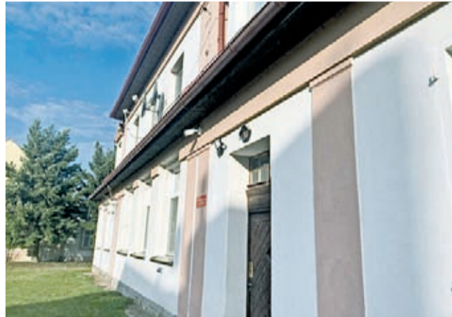
Kamera na świetlicy w Chwalimierzu