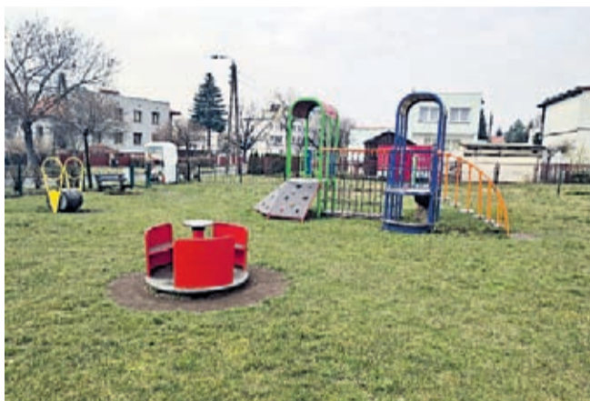
Odnowiony w zeszłym roku plac zabaw przy ul. Słonecznej w Środzie Śl.

W tym roku planowane są jeszcze przetargi na doposażenie nowego placu zabaw w Brodnie oraz zamontowanie nowego zestawu zabawowego przy ul. Spacerowej w Ciechowiu.