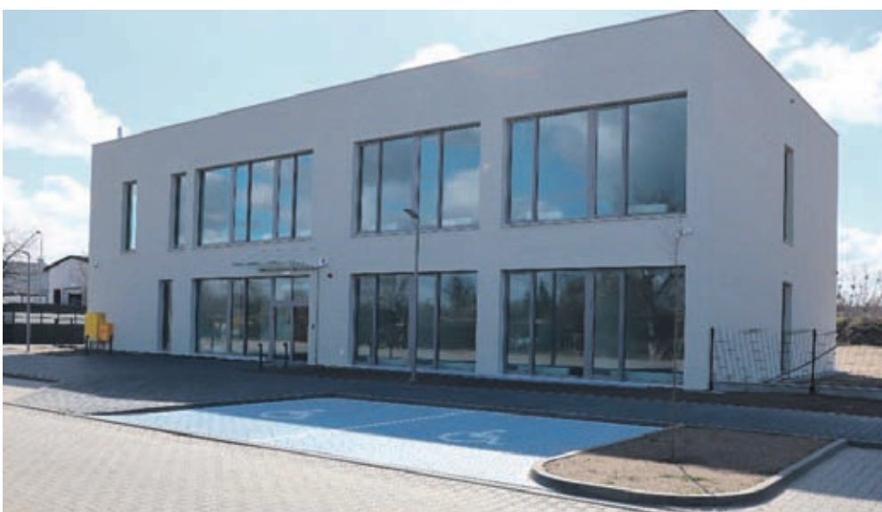
Końcowa faza budowy Średzkiego Inkubatora Przedsiębiorczości przy ul. Spółdzielczej