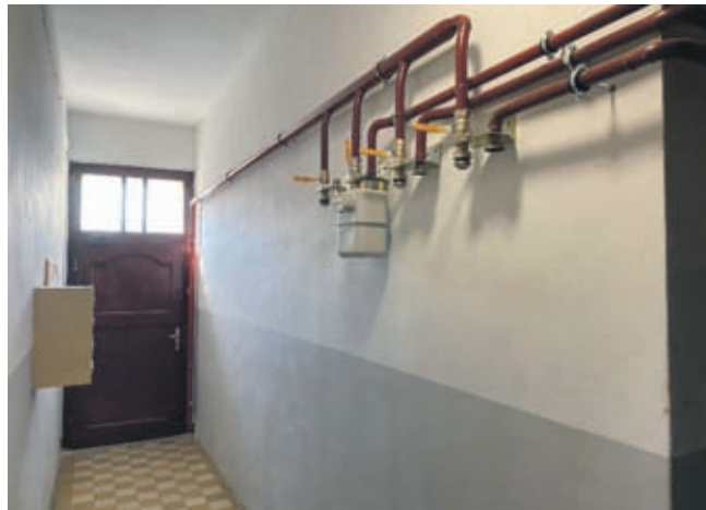
Ul. Kolejowa 8w Środzie Śląskiej z nową instalacją gazową

Na terenie miasta i gminy Środa Śląska trwają lub niedawno zakończyły się gminne inwestycje zarówno na drogach, terenach gminnych, jak i w lokalach komunalnych.