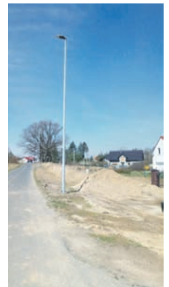
Nowe lampy led w Przedmościu

Na ukończeniu są prace związane z montażem instalacji gazowej w mieszkaniach Gminy - na ul. Kolejowej 8 i ul. Daszyńskiego 15 - 3 mieszkania. Podobne prace przeprowadzono na ul. Świdnickiej 13, Malczyckiej 26 i na ul. Św. Andrzeja 1. Wartość kontraktu z firmą Ps-Serwis ze Środy Śląskiej to ponad 170 tys. zł.