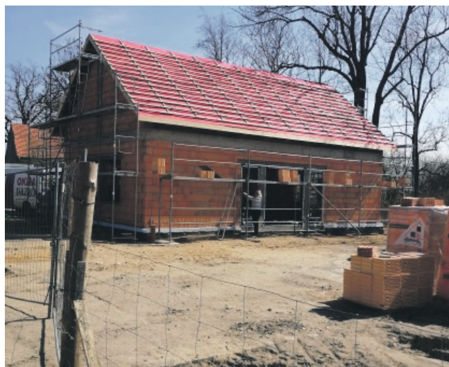
Świetlica w Jugowcu w budowie