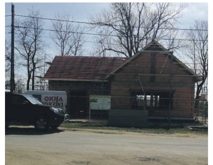
Świetlica w Jugowcu w budowie