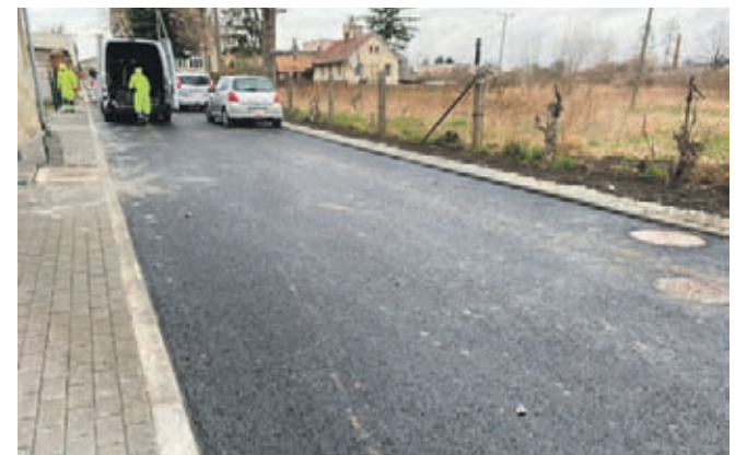
Ul. Kasztanowa w Środzie Śląskiej

W Przedmościu kończy się budowa 9 nowych lamp, na terenie nowego osiedla tzw. „Pod Dębami”. Prace wykonuje firma PBS Polska z Wrocławia, która w ramach tego samego kontrak-