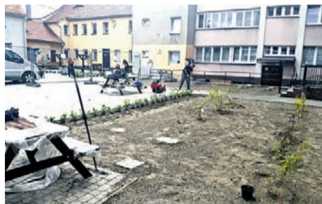
Ostatnie prace związane z nasadzeniami drzew i krzewów zakończyły się jeszcze w maju