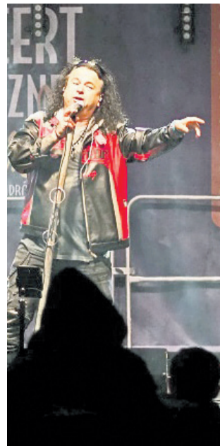
Sobotnią uroczę muzyczną koncertem „Do Ciebie,

Mocne brzmienie i dawka dobrego humoru – tak wyglądała inauguracja sezonowych imprez plenerowych w Środzie Śląskiej. W sobotę na Rynku Dolnym wystąpili młodzi artyści oraz zespoły Big Day i Vincent. W niedzielę scenę przejęli artyści kabaretowi. Nie zabrakło atrakcji dla dzieci.