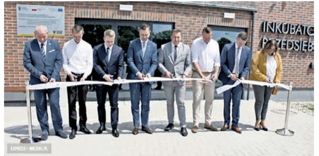
Budowa dwukondygnacyjnego budynku o pow. użytkowej

blisko 800 m 2 trwała 1,5 roku. W obiekcie znajduje się m.in. 14 lokali biurowych o pow. od 12 m 2 do 26 m 2 . Już w pierwszym miesiącu działalności, w inkubatorze zostało zajęte ponad 50 proc. powierzchni przeznaczonej na podejmowanie i rozwój działalności gospodarczej przez lokalne firmy z powiatu ząbkowickiego i okolicznych gmin. Wśród firm w budzowskim inkubatorze do tej pory znalazły się m.in. biuro rachunkowe, kancelaria prawna i studio fotograficzne. Umowy z przedsiębiorcami zawierane są na okres maks. 3 lat.