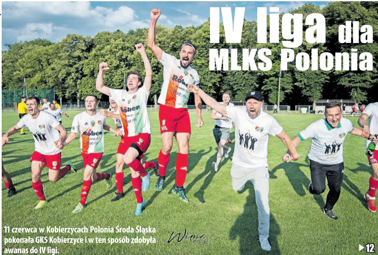
11 czerwca w Kobierzycach Polonia Środa Śląska pokonała GKS Kobierzycy i w ten sposób zdobyła awans do IV ligi.