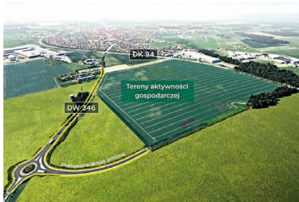
Wizualizacja planowanej inwestycji drogowej

Sama inwestycja drogowa zaplanowana jest do realizacji na 2023 rok . W czerwcu rozpoczął się proces projektowy i kompletowanie niezbędnej dokumentacji inwestycyjnej - na podstawie pełnomocnictwa udzielonego przez burmistrza Środy Śląskiej.