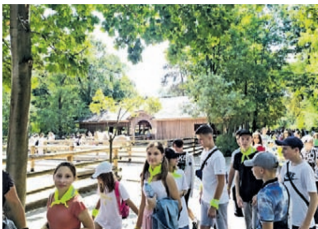
Fot. Wycieczka do ZOO Wrocław

Przyjazd uczniów z Kamionki Buskiej wpisuje się w kilkunastoletnią tradycję wymiany młodzieży polsko-ukraińskiej, dlatego nie zabraknie też wizyty gości w SP 3. Miłego odpoczynku!