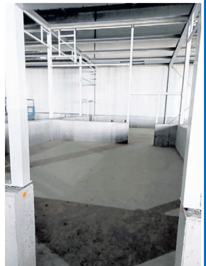
Aktualny wygląd laboratorium

Rozmawiała: Karolina Matczak, Specjalista ds. Pozyskiwania Talentów, koordynująca działania dotyczące marki pracodawcy PepsiCo w Polsce.