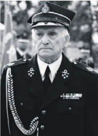
OCHOTNICZA STRAŻ POŻARNA W MALCZYCACH

Składamy wyrazy najgłębszego współczucia. Ceremonia pogrzebowa odbyła 19 sierpnia na cmentarzu komunalnym w Malczycach.