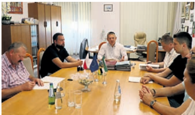
Inwestycja jest kontynuacją oddanego do użytku wiosną 2018 roku I etapu budowy osiedla so-

18 sierpnia burmistrz podpisał z firmą KIZ s.c. ze Środy Śląskiej kontrakt na budowę kolejnych mieszkań socjalnych na osiedlu przy ul. Wiejskiej w Środzie Śląskiej. Budowa jest możliwa dzięki dwóm dotacjom pozyskanym przez średzką Gminę – 3 mln zł z Banku Gospodarstwa Krajowego i 500 tys. zł z rządowego Funduszu Inwestycji Lokalnych.