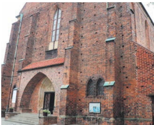
Niedługo mają ruszyć konserwacja szczytowej ściany kościoła pw. Podwyższenia Krzyża Świętego w Środzie Śl.