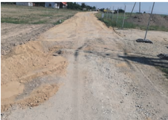
Początek prac w Kulinie