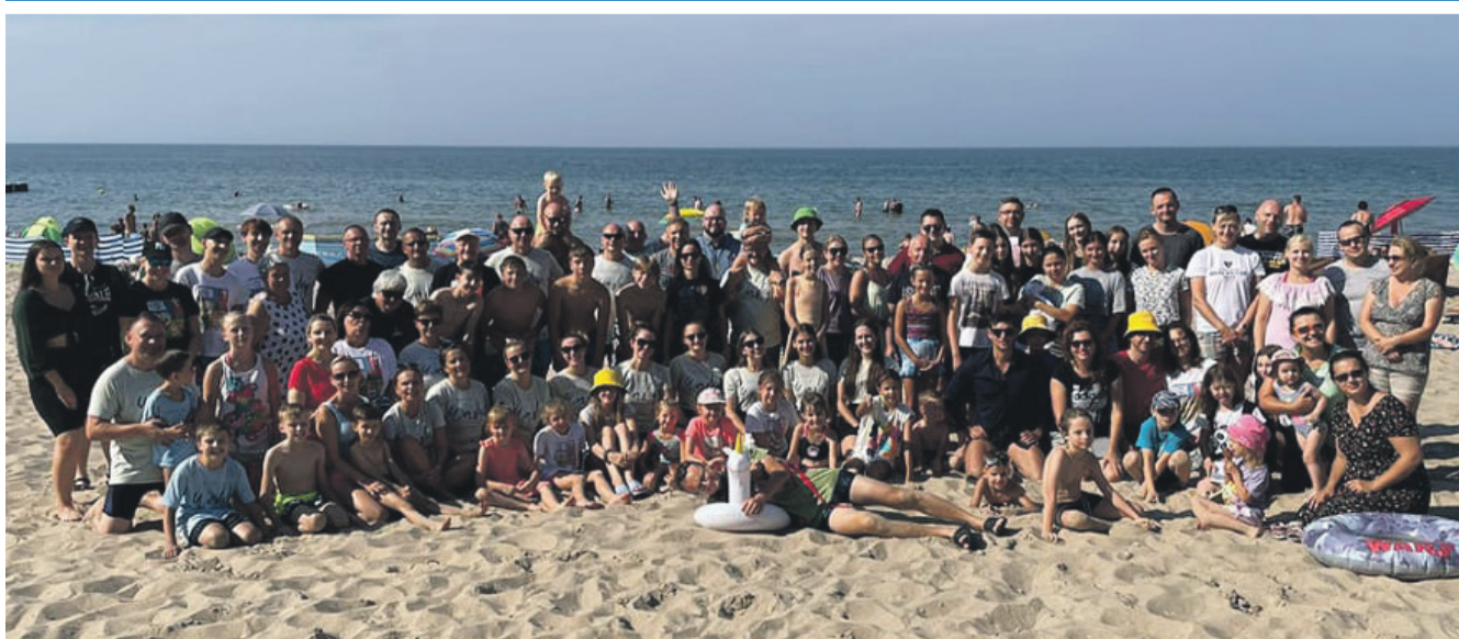
Gdzie trwają wczasorekolekcje dla rodzin, organizowane przez Stowarzyszenie Salezjanów Współpracowników z naszej parafii. Jeśli ponad 100 osób pozuje do zdjęcia, to musiało być głośno! Parafia św. Andrzeja Apostoła w Środzie Śląskiej Salezjanie