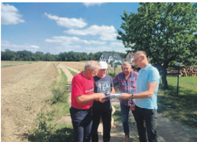
Przekazanie placu budowy w Kobylnikach

com. Łączna wartość umowy na budowę dróg transportu rolnego w 5 wsiach to ponad 871 tys. zł,