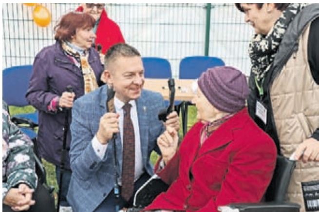
Wydarzenie zorganizował Dzienny Dom Seniora na cze-

Seniorzy z Dziennego Domu Seniora, Klubu Seniora przy Centrum NGO oraz Związku Emerytów Rencistów i Inwalidów wzięli udział w pierwszej edycji Marszu Aktywnego Seniora na Stadionie Miejskim w Środzie Śląskiej.