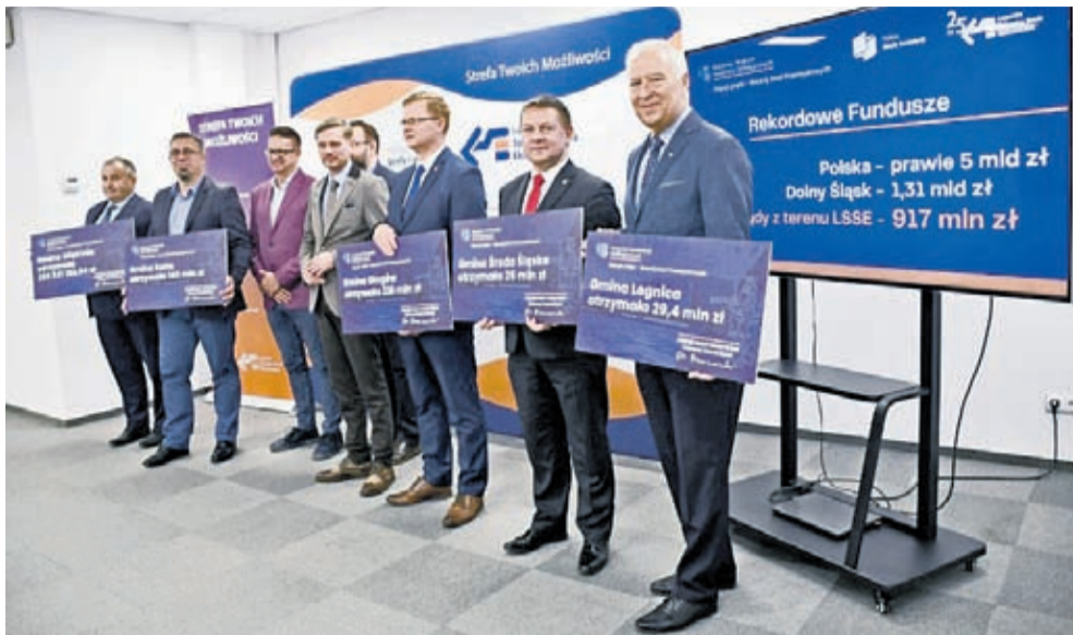
Beneficjenci dotacji z Polskiego Ładu w LSSE w Legnicy

– To historyczne wydarzenie dla Legnickiej Specjalnej Strefy Ekonomicznej. Bardzo się cieszę, że dofinansowanie otrzymały priorytetowe projekty i strategicz-