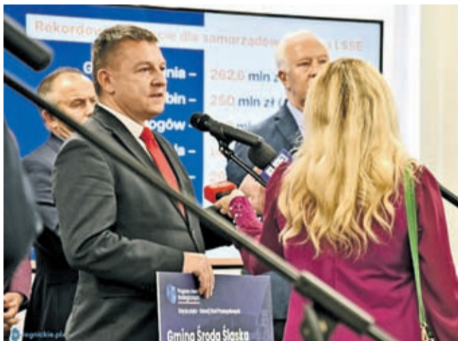
Konferencja prasowa w siedzibie LSSE w Legnicy – 17 X