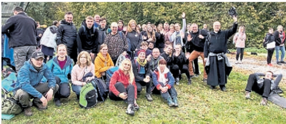
Bogu niech będą dzięki za piękny czas wędrówki i modlitwy, za każdą Siostrę i Brata. Parafia św. Andrzeja Apostoła w Środzie Śląskiej Salezjanie