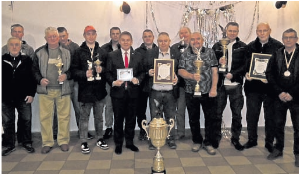
Podsumowanie sezonu lotowego w Brodnie

Dorosłe gołębie hodowców brały udział w wcześniej zaplanowanych 14 lotach konkursowych. Miały one do pokonania