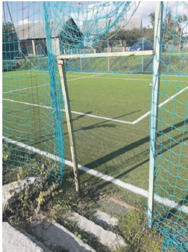
Piłkochwyty na orliku w Słupie przed odmalowaniem

Po tym, jak w październiku ubiegłego roku Gmina Środa Śląska dokonała modernizacji nawierzchni murawy boiska Orlik we wsi Słup za blisko 100 tys. zł, w październiku br. grupa mieszkańców odmalowała ogrodzenie tego boiska i poprawiła stan siatek – zgodnie z deklaracją sołtysa Andrzeja Rędzio z lipca tego roku.