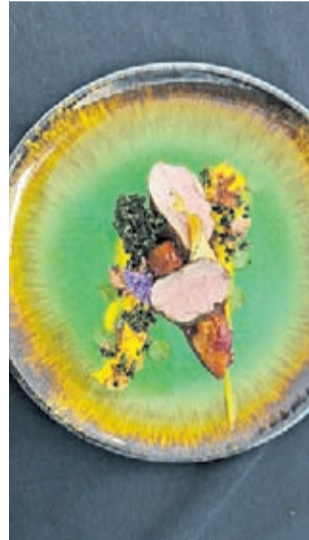
Finałowe danie uczennic PZS nr 2 w Środzie Śląskiej