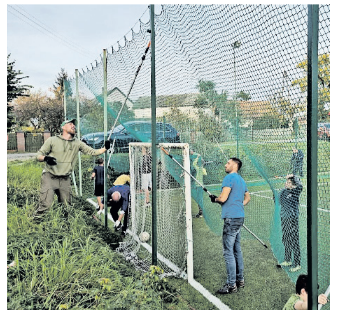
Mieszkańcy Słupa pod koniec X br. odmalowali piłkochwyty

obiekту sportowego. Ta oddolna inicjatywa stanowi ważne uzupełnienie gminnej inwestycji z ubiegłego roku – dodaje wóldarz.