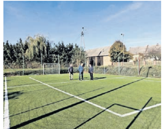
WX 2021 roku Gmina Środa Śl zmodernizowała murawę Orlika we wsi Słup

- Dziękuję zaangażowanym mieszkańcom Słupa z panem sołtysiem i panem radnym za odnowienie konstrukcji i naprawę