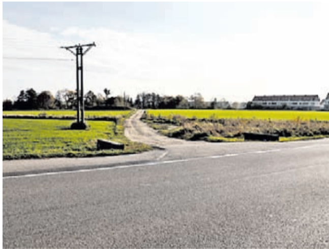
Planowany początek obwodnicy od ul. Kolejowej

otrzymała 4,4 mln zł w ramach II edycji Rządowego Funduszu Polski Ład Program Inwestycji Strategicznych. II etap Północnej Obwodnicy Środy Śląskiej obejmuje budowę drogi zbiorczej od ul. Kolejowej do ul. Sikorskiego, łączącej stację kolejową z osiedlem PDD S.A i docelowo z drogą krajową 94, której planowana