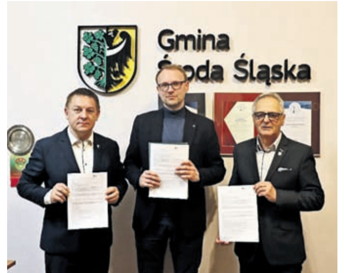
Burmistrz, Pełnomocnik Eurovii i radny z okręgu ul. Sikorskiego i Kolejowej

Na budowę II etapu Północnej Obwodnicy Środy Śląskiej Gmina otrzymała w maju 2022 środki w wysokości 4,4 mln zł w ramach Rządowego Funduszu Polski Ład - Program Inwestycji Strategicznych. Nowa droga wraz z rondem i ciągiem pieszo-rowerowym ma zostać oddana do użytku w II połowie 2023 roku.