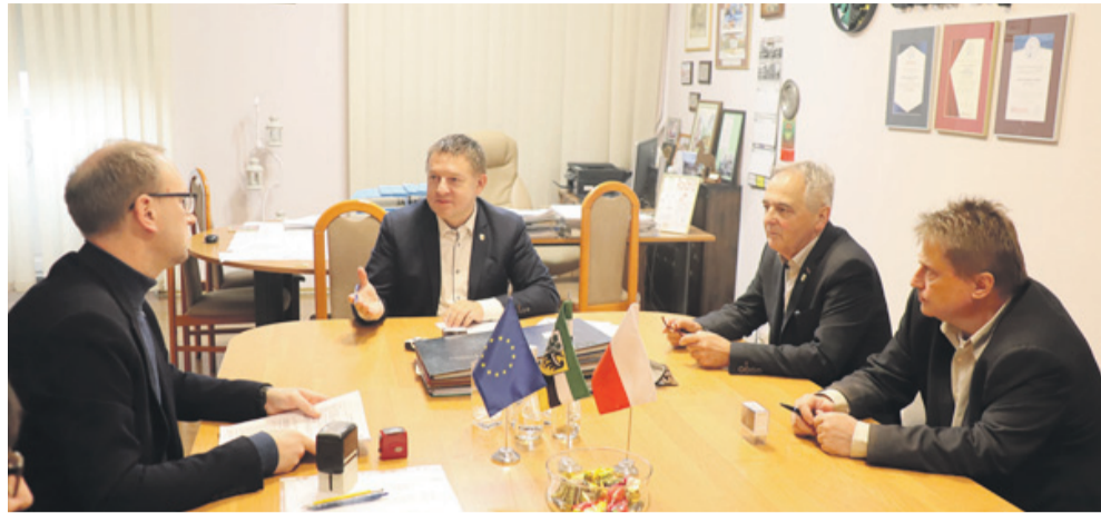
Podpisanie kontraktu z firmą Eurovia 24 listopada br.

Wartość całego kontraktu wynosi 5,52 mln zł. II etap Północnej Obwodnicy Środy