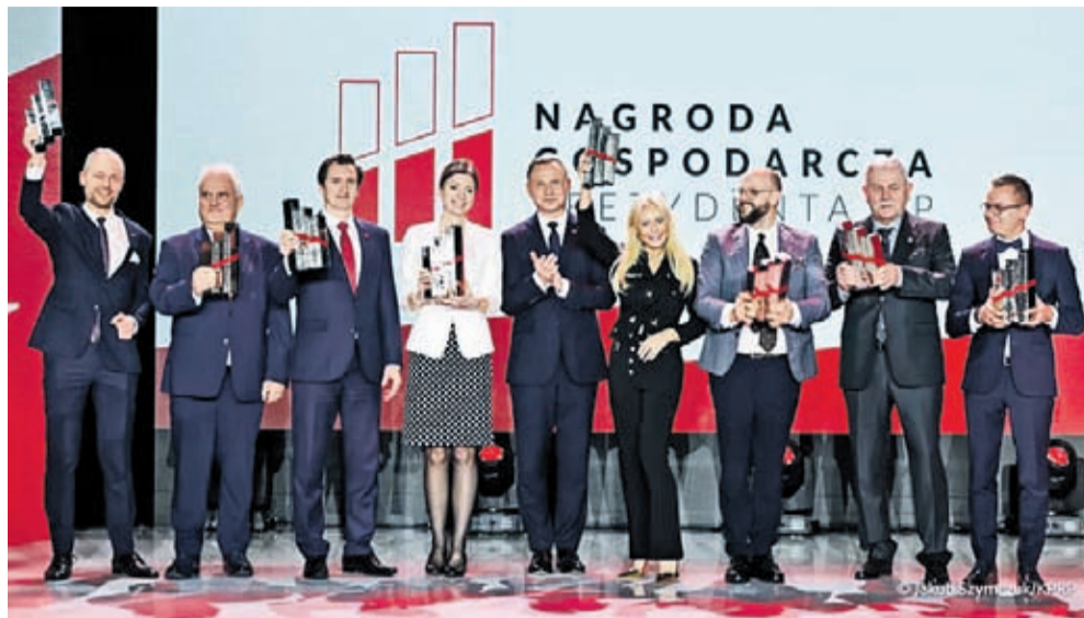
Laureaci XX edycji Nagrody Gospodarczej Prezydenta RP z Andrzejem Dudą

Tematem wiodącym 7. edycji Kongresu 590 była