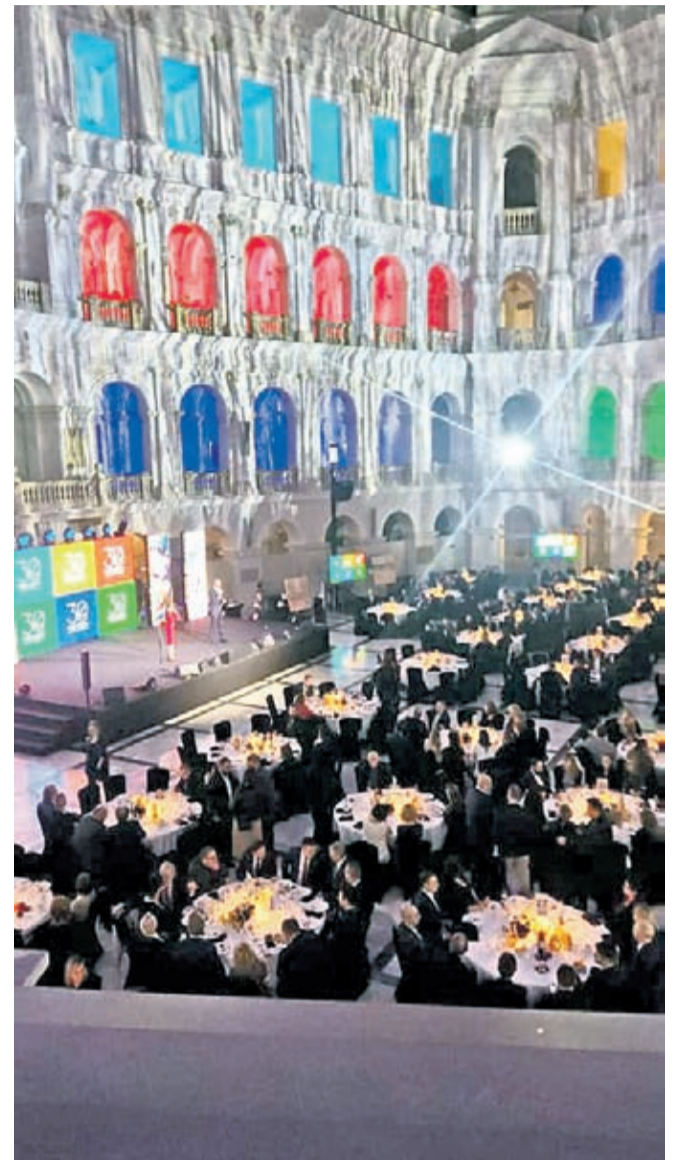
Gala 30-lecia BASF Polska na Politechnice w Warszawie