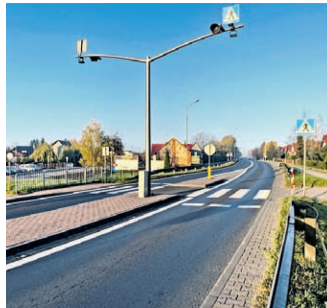
Przejście na ul. Legnickiej w Środzie Śl przy wyjeździe w stronę Proszkowa

i Na wszystkich trzech przejściach zostaną zamontowane po dwie lampy doświetlające. Dodatkowo, przy przejściu dla pieszych w Komornikach od strony Wrocławia ustawiona zostanie sygnalizacja ostrzegawcza – aktywny znak D-6.