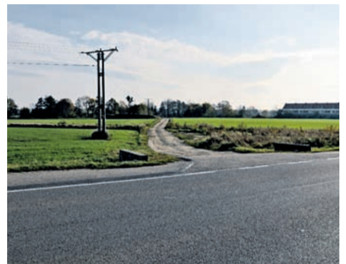
Planowana trasa obwodnicy od strony ul. Kolejowej