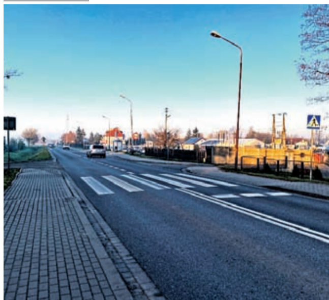
Przejście dla pieszych na DK 94 w Komornikach od strony Legnicy

W ciągu roku, trzy przejścia dla pieszych w ciągu DK94 będą oświetlone. Ułożone zostaną też płytki ostrzegawcze dla osób niewidomych. To efekt ponad dwuletnich rozmów i korespondencji z udziałem GDDKiA, Urzędu Miejskiego w Środzie Śl i mieszkańców.