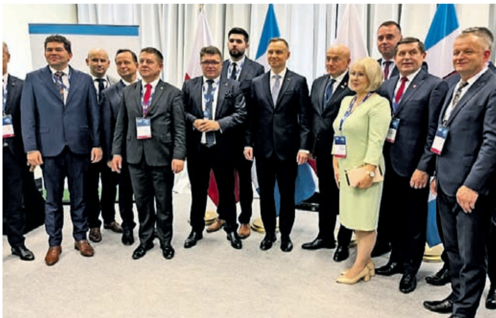
Samorządowcy z Narodowej Rady Rozwoju z Prezydentem RP