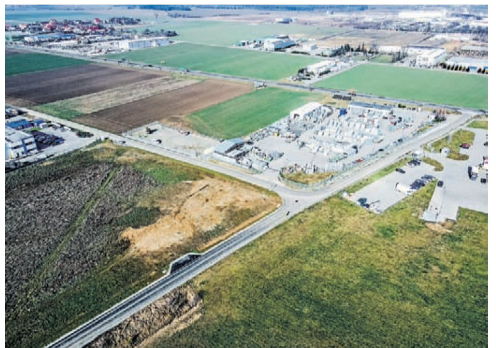
ul. Familijna i Muzyczna_Źródła

Dużo działa się w Wilkszynie. Powstała droga do gruntów rolnych poprzez przebudowę ul. Szkolnej na odcinku 710 m. Całkowita wartość zadania wyniosła 848 700 zł.