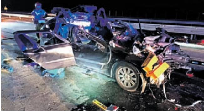
10 lutego w nocy strażacy z jednostki w Ujeździe Górnym zostali wezwani do zderzenia auta osobowego z autem ciężarowym na 120 km autostrady A4 w kierunku Wrocławia. OSP KSRG UJAZD GÓRNY