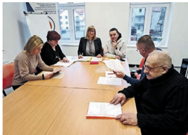
Gminna Komisja Rozwiązywania Problemów Alkoholowych

Członkowie GKRPA po przyjęciu wniosku o leczenie odwykowe złożonego przez osoby prywatne lub instytucje, zapraszają osobę, której wniosek dotyczy na rozmowę wyjaśniającą-motywowującą do zgłoszenia na leczenie odwykowe. Kolejnym krokiem może być skierowanie tej osoby na badanie przez biegłego lekarza w celu wydania opinii i wskazania rodzaju zakładu leczniczego.