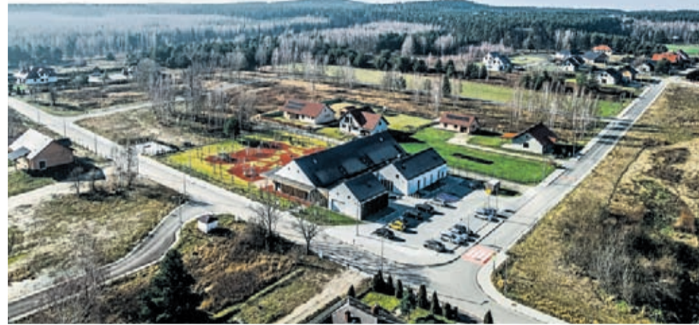
ul. Willowa, Dębowa, Kalinowa w Miękini

Tylko w ubiegłym roku na przebudowy i remonty dróg gminnych Gmina Miękinia przeznaczyła 14 923 152 zł. Rok 2023 zapowiada kolejne ważne inwestycje w tym zakresie.