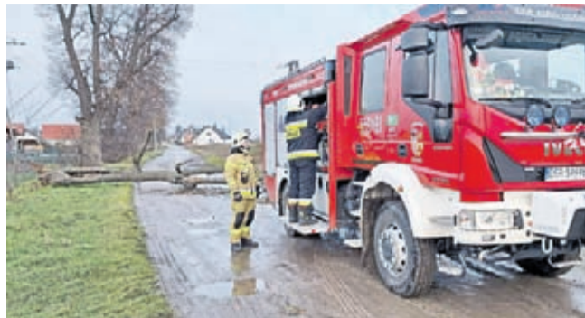
2 lutego strażacy z Udanina wezwani zostali na ulicę Lipową. Powalone przez wiatr stare drzewo blokowało drogę w obu kierunkach. OSP KSRG Udanin