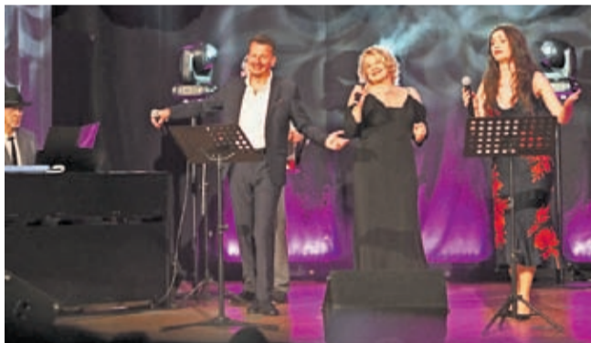
Koncert „Pod Niebem Paryża” 8 marca w Średzkim Domu Kultury

W Środzie Śląskiej Dzień Kobiet rozpoczął się koncertem „Pod Niebem Paryża” w Domu Kultury, gdzie największe francuskie przeboje wybrzmiały w wykonaniu artystów z Polski, Ukrainy, Portugalii i Białorusi. ▶ 2-3