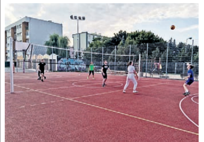
Na orliku przy Mostowej animator poprowadzi zajęcia m.in. z siatkówki

Ośrodek Sportu i Rekreacji w Środzie Śląskiej podpisał 6 marca umowę z lokalnym animatorem sportu na organizację zajęć sportowych dla dzieci i młodzieży.