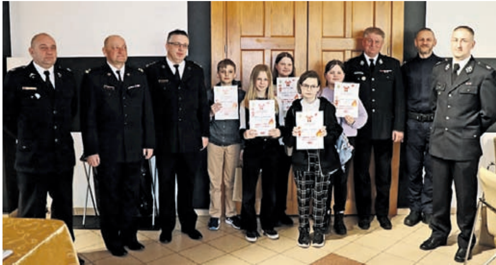
Uczestnicy finału z SP Szczepanów

10 marca w finale Gminnego Turnieju Wiedzy Pożarniczej zmierzyło się 20 uczniów z czterech szkół podstawowych w Gminie Środa Śląska. Laureaci trzech pierwszych miejsc w dwóch kategoriach odebrali nagrody ufundowane przez Burmistrza Środy Śląskiej.