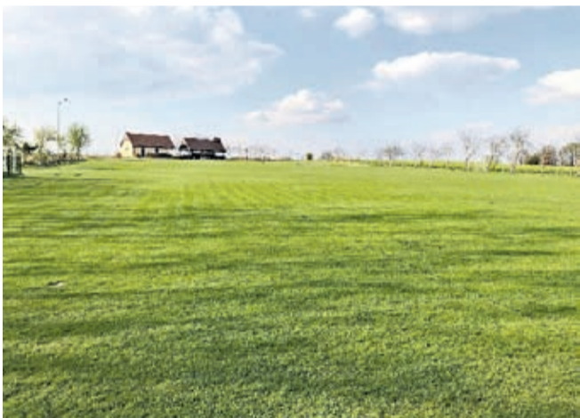
Boisko sportowe w Ogrodnicy

Kolejnym etapem będzie wykonanie odwiertów. Podstawową funkcją studni na boisku sportowym jest nawodnienie boisk w okresie suszy, o co zabiegają kluby z Proszkowa i Ogrodnicy.