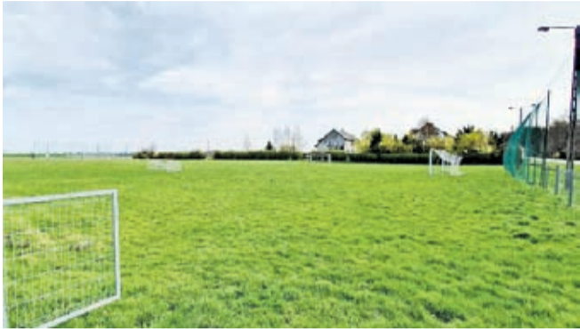
Boisko sportowe w Proszkowie

Na początku kwietnia Gmina podpisała umowę z firmą El-Geo z Wilkowa na opracowanie projektów robót geologicznych dla dwóch studni służących do nawadniania boisk sportowych w Proszkowie i Ogrodnicy.