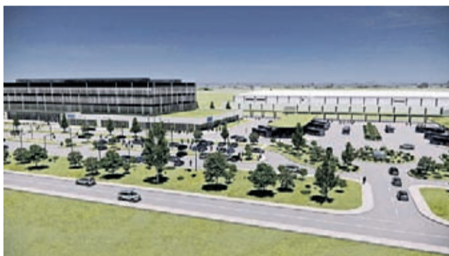
500 km od Magdeburga, na linii Wrocław – Miękinia- Środa Śląska, do 2027 powstanie zakład

Dolny Śląsk jest również „Intel inside” – powiedział minister Janusz Cieszyński , który podziękował za zaangażowanie w projekt burmistrzom Miękini i Środy Śląskiej oraz marszałkowi Dolnego Śląska.