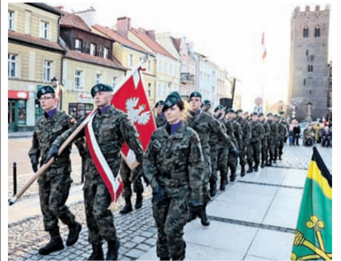
Żołnierze X Wrocławskiego Pułku Dowodzenia na Święcie 3 Maja w Środzie Śląskiej