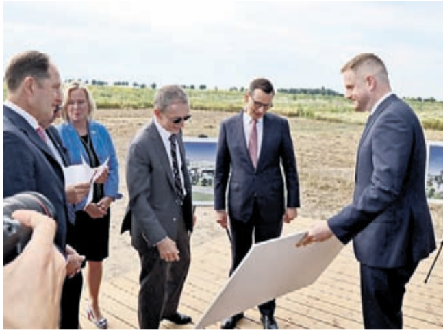
Wietnamie, Irlandii, a planowany jest zakład w Magdeburgu. integracji i testowania półprzewodników krzemowych. – Od dziś

Prezes Intel Pat Gelsinger podkreślał, że będzie to jeden z najważniejszych zakładów Intel na świecie. Wskazywał, że fabryki Intel są już m.in. w Stanach Zjednoczonych (Ohio, Arizona i Oregon), Kostaryce, Chinach,