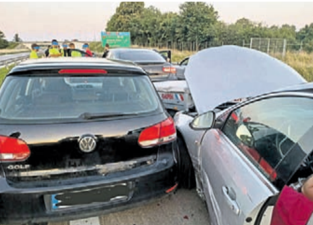
Siedem samochodów osobowych zderzyło się 7 lipca. Do zdarzenia doszło na 124 km A4 w kierunku Wrocławia.