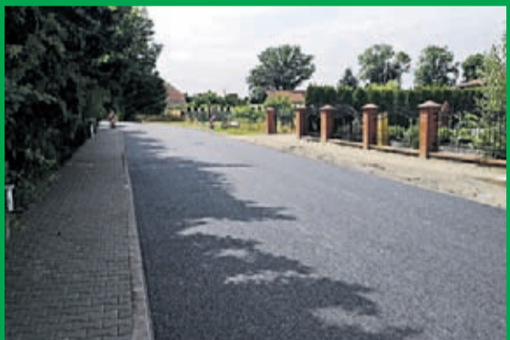
Wróblowice - Akacyjowa

Za kwotę 582 732,44 zł firma POL-DRÓG remontuje nawierzchnię ul. Długiej i Akacyjowej we Wróblowicach. Dotychczas wykonano nakładkę bitumiczną nawierzchni na długości 910m, obecnie trwają prace wykończeniowe.