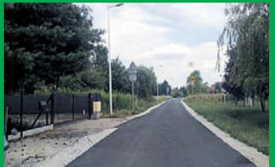
Żurawiniec - Spokojna

W Żurawincu (ul. Słoneczna, Spokojna), Kkorzycach (ul. Stawowa i Zamkowa), Błoniu (ul. Akacyjowa), Wilkszynie (ul. Końcowa), Gąsiorowie (ul. Ogrodowa) i Czernej firma „BISEK” zakończyła wykonanie nakładek bitumicznych. Wartość zadania wyniosła 638 157,83 zł brutto.