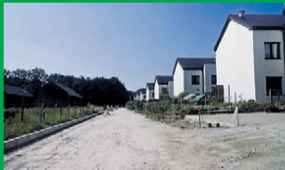
Wilkszyn - Kalinowa