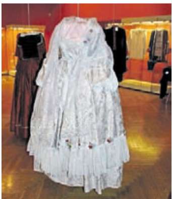
Muzeum Regionalne w Środzie Śląskiej

Pobieramy kaucję (gotówką), która wynosi 50 zł i jest zwracana w momencie oddawania stroju, o ile nie został on uszkodzony. Strój można wypożyczyć wcześniej, ale wtedy naliczane są dodatkowe opłaty. Przykładowo: jeżeli pożyczymy go w środę, a oddajemy we wtorek naliczamy dodatkowo 20 zł; jeżeli pożyczymy w czwartek i zwracamy we wtorek to 10 zł. W razie pytań można do nas napisać albo zadzwonić (71) 396 09 15.