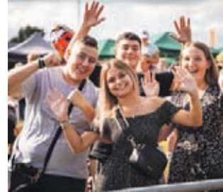
raz”, „Hop hop”, „Królowa”, czy „Musisz się starać”. Gwiazdami wieczoru był zespół Milano z przebojami „Jasnawłosa”, „O Tobie