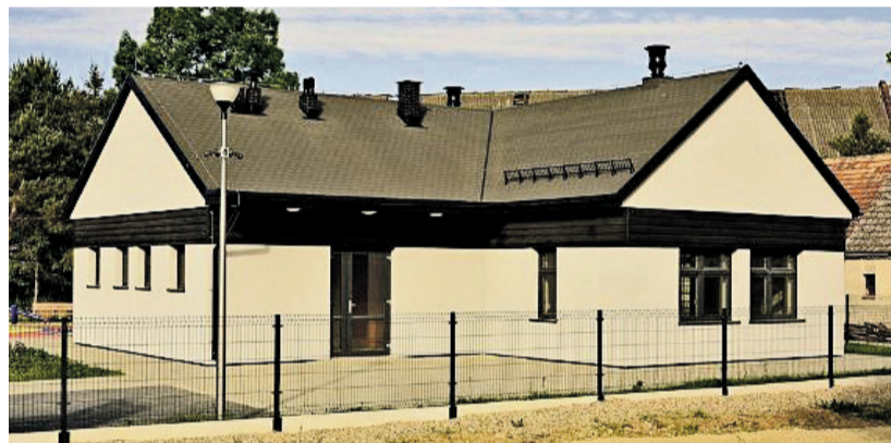
Cztery z 11 nowych lokali wyborczych w świetlicach: Jugowiec, Rzeczycy, Wrocisławice, Kobylniki