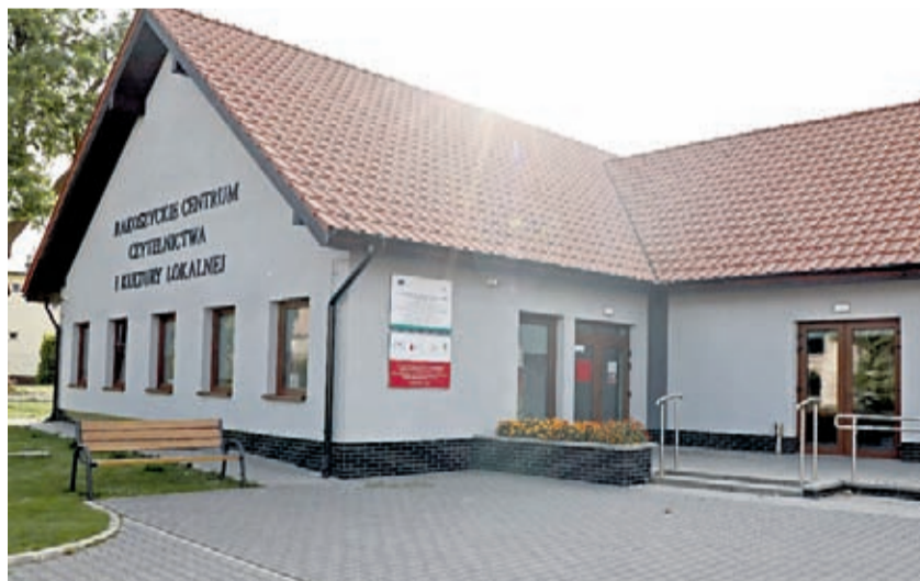
Nowy lokal wyborczy – RCCiKL w Rakoszycach