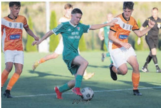
Podopieczni trenera Maksymowicza, po bardzo dobrym spotkaniu, przegrali jednak u siebie z Baryczą Sułów 0:2. Jak napisał trener Dariusz, mieliśmy swoje okazje do zdobycia bramek, ale w tym razem nic nie weszło. MLKS POLONIA ŚRODA ŚLĄSKA/ FOT:WIME.NET.PL

Swój mecz ligowy rozegrali też nasi juniorzy.