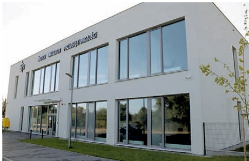
Nowy lokal wyborczy - Średzki Inkubator Przedsiębiorczości

Na wniosek burmistrza Środy Śląskiej Komisarz Wyborczy zmienił siedziby dwóch Obwodowych Komisji Wyborczych. Od 15 października br. lokale wyborcze będą mieścić się w Średzkim Inkubatorze Przedsiębiorczości – dla obwodu wyborczego nr 1 oraz w Rakoszyckim Centrum Czytelnictwa i Kultury Lokalnej – dla obwodu wyborczego nr 16.