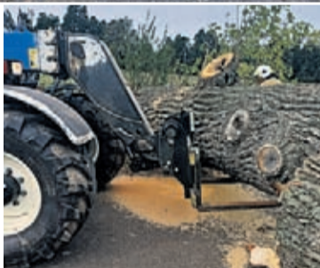
OSP KSRG Udantin

Powalone drzewo zablokowało w środę 4 października drogę Pichorowice-Ujazd Górny. Z problemem uporali się strażacy z OSP KSRG Udantin i OSP KSRG Pichorowice.