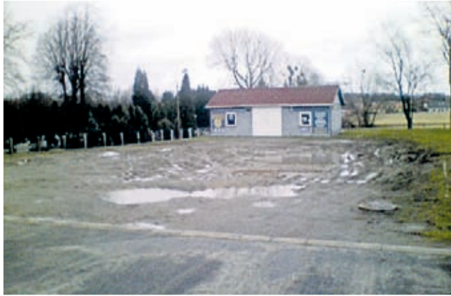
Parking przy ul. Cmentarnej w Środzie Śląskiej przed dokończeniem remontu.

Odnowienie przestrzeni parkingowej przy średzkim cmentarzu komunalnym to inwestycja potrzebna dla mieszkańców. Dzięki rewitalizacji drugiej części parkingu mieszkańcy nie chodzą już po błocie na cmentarzu.