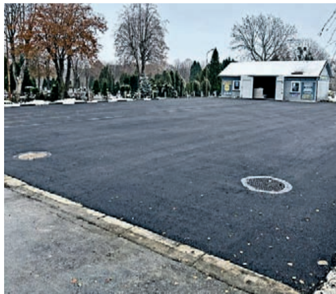
Parking przy ul. Cmentarnej część zrewitalizowana w 2023 r.

Grudniowe prace na parkingu przy cmentarzu komunalnym to dokończenie inwestycji rozpoczę-