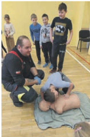
SP W UJEŹDZIE GÓRNYM

Serce naszej edukacji stanowił również pokaz korzystania z defibrylatora, który może okazać się kluczowy w ratowaniu życia.