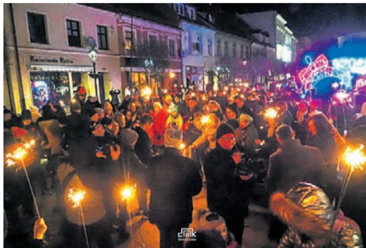
Fot. Światelko do nieba w Średzkiem Rynku Dolnym